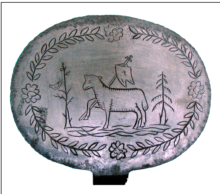
Molnárkalács-sütő vas a Borsod-Abaúj-Zemplén Megyei Bányászattörténeti Múzeum (Rudabánya) gyűjteményéből.