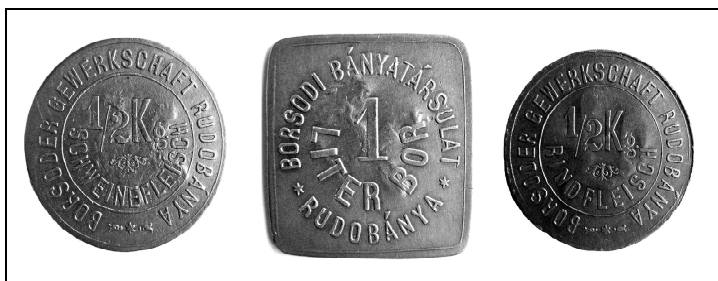
A Borsodi Bányatársulat ellátási bárcái (1914 előtt). Balról jobbra: sertéshús, bor, marhahús. (Lsz.: B.68.138.1-3.)

A pénz elértéktelenedése miatt 1946. március 1-től országosan bevezették a dolgozók és családtagjaik részére a kalóriaellátást. Eszerint a bányászok hetente a következő kalóriamennyiségnek megfelelő élelmiszert kaptak: föld alatti vagy nehéztesti dolgozó 21.400 kcal, testi és szellemi dolgozó 18.500 kcal, családtag 5000 kcal. 20 A következő élelmiszerfajták kerültek kiosztásra: kenyér, főzőliszt, burgonya, bab, borsó, tojás, túró, káposzta, hagyma, gyümölcsíz, olaj.