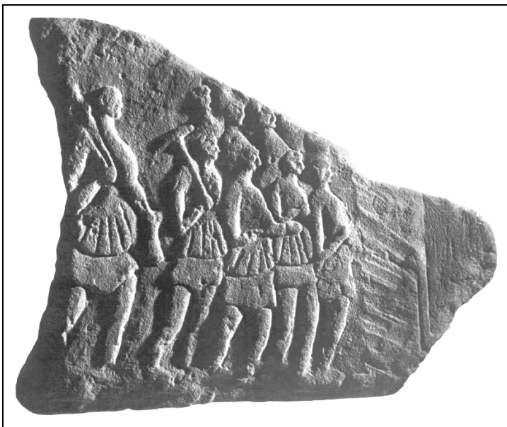
Római bányászcsoport Linaresből.

képcsoportozattal, melyről több más emlékkal mellékesen dr. Berglang emlékezett meg először Los Bronces de Lascula Bonanza y Aljustrel (1881. p. 686.) c. művében Daubrée , a francia tudós közölte a Revue archaologique -ban (1882. évf. p. 193.) egy Spanyolország több vidékéről származó tárggyal együtt egy csoportozatban. (Fol. V.)