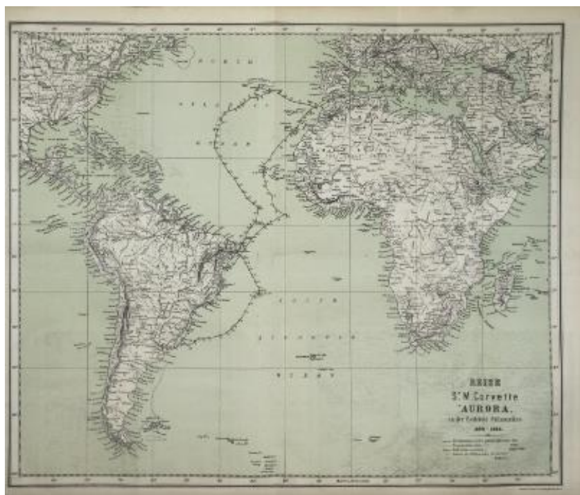
Egy térképlap a hajó útjáról. 2236