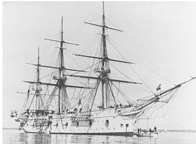
SMS Donau (III.)

(Az utolsó gőzkorvett vagy csavaros korvett, amit az Osztrák-Magyar Monarchia flottája számára építettek. A Monarchia egy Donau nevű vitorlás fregattja 1811-ben süllyedt el a rajta volt kincsekkel és lőszerrel együtt. Kiemelésével 1889-ben kísérleteztek. 730 Így a Donau III. a gőzhajók között viseli a képzeletbeli III-as számot.) Az SMS Donau egyike az osztrák-magyar flotta legnagyobb fakorvetjeinek, egyedül a Saida múlja felül. 731 Testvérhajója nincsen, bár van aki a Saida-t (1876) annak tekinti.