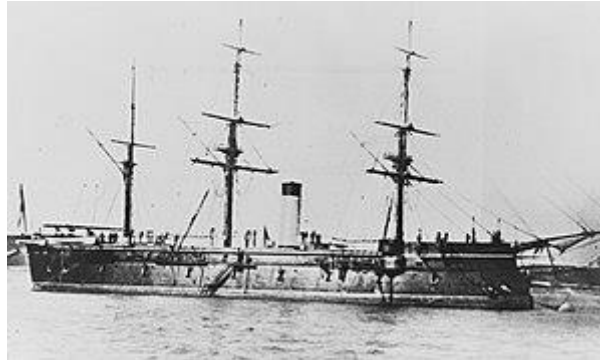
A Habsburg modernizálása után 1877-ben 430