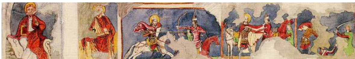
Sepsibesenyő falképe. 265

A korszak hadieseményeinél alapvető szerepet játszott a lovasság, ezért meg kell említenem a lovasfelszerelés néhány fő jellemzőjét. Ezen anyagcsoport legfőbb elemei: a nyereg, a kengyelvas, a zabla, a sarkantyú és a patkó.