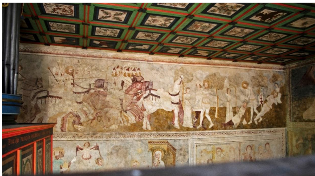
Karaszko, Szent László falkép. 202

Összességében megállapítható, hogy a fennmaradt, a 13. század vége és a 15. század vége között keletkezett falképek zöme, egykor jeles szerepet játszó helységeben található. Olyan településeken, amelyek egykor összeköttetésben voltak a királyi hatalommal, jelentős