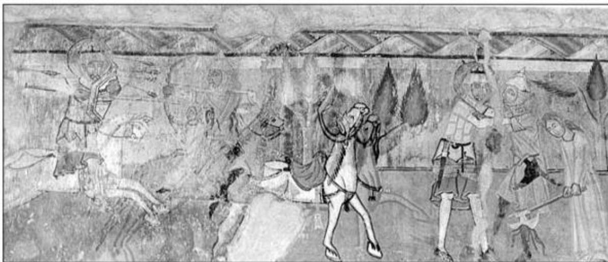
Gelencei (Ghelința) római katolikus templomban lévő falfestmény. 273

A középkori magyar múlt értékes emlékei a Szent László legendát megjelenítő, korunkig fennmaradt, illetve tudományos dokumentációkból ismert falképek. A történelmi Magyarország harmincnegyedik templomából ismeretesek ilyen emlékek. 272 E szám még bővíthet, az eddig ismert képek jelentős részét is meszelés alól tárták fel az elmúlt száz évben. Igyekeztem jelen előadásomban jellemző példákat bemutatni a 13. század vége és a 15. század vége közötti időszakban továbbélő ősi magyar fegyverzeti- és viseleti emlékekről. Olyan materiát kutattam, amely elsődlegesen a magyarsághoz később kapcsolódó keleti jellegű, csak később feudizálódó népek, így a kunok, besenyők körében volt általános.