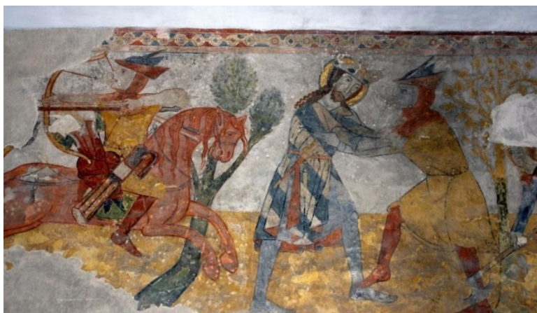
Szent László legenda, birkózó jelenet, Kakaslovnica. 234

A korábbi tegezek esetében a tegezszájat a száj alatt egy feltehetően bőrből készült takaró fedte. Ezt használatkor kikapcsolták, s a tegezfedő a tegez tengelye irányában lecsapódott. Az újabb formák kúpos testűek, oldalaik egyenesek. Alapvetően hasonló formák is ismeretesek, de teljesen eltérő tegezfedővel, amely oldalt ajtó-szerűen lecsapódik, illetve eltérés a tegez testének kürtőszerű kiszélesedése alsó irányba. Kérdéses a tegezek egykori felfüggesztése, tartófelületet ugyanis csak a legritkább esetben jelenítettek meg képeken. A tegez nyírfakéregből, vagy vastag bőrből készült, tetejét, fenekét falemezzel megerősítették. 233 László Gyula következőképpen rekonstruálta ezt az igen jellegzetes felszerelési tárgyat: