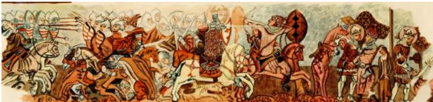
Sepsi-kilény, a cserhalmi ütközet vagy kerlési csata és Szent László párbaja a kun vitézzel. 200

A fentiek alátámasztására felsorolok néhány példát. Az erdélyi területen található freskók esetében megemlíthető, hogy Erdőfüle (Filia) egykor a jelentős szerepet játszó nemesi família, a Dánielek birtoka volt. Homoródszentmárton (Mártinis) egyházi központ volt. A községben templomvár is volt. Maksa (Moacsa) falu a székelyek gyűléseinek adott otthont, itt is emeltek templomvárat. Sepsikilyénben (Chilieni) bíraskodott a székelyek ispánja. Székelyderzs (Dirjiu) ugyancsak templomvárral rendelkezett, s különféle tisztségviselőknek volt a székhelye.