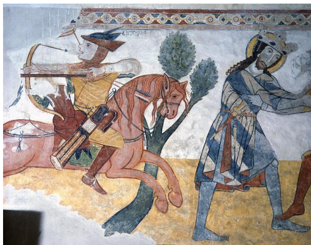
Kakaslomnic freskója. 267

A keleti típusú nyereg ősi magyar formákat követett, ezt használta a könnyűlovasság. Kápai alacsonyak voltak, a ló hátára két oldaldeszkájával feküdt. A két nyeregszárny csupán középen, egy-egy kis felületen tapadt a lóra. A nyeregszár nyak vége felhajlott, s így ez nem akadályozta a ló mozgását. A két oldaldeszkás nyeregkialakítás lehetővé tette a kényelmes, hátrafelé dülő hátsó kápa kialakítását. A hevederezésnél a nyeret a ló marjáig előre tették. Ez a típus kiválóan megfelelt a könnyűlovás harcmodor követelményeinek. A nyeregben ülő harcos szabadon hajladozhatott, nem akadályozta semmi a hátrafelé nyilazást, a szablya használatot minden irányban, stb. 266