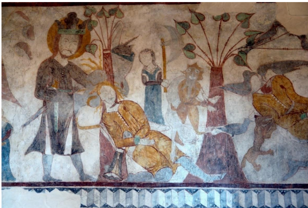
Vitfalva római katolikus templom freskója a Szent László legenda jelenetével. 201

Összehasonlítva ezeket az épületeket későbbi korok templomaival, méretüket tekintve kicsinek tűnhetnek. Más eredményt mutat azonban, ha a saját korukból fennmaradt egyszerű, falusi istenházakkal vetjük össze. Ebben az összehasonlításban szembetűnően nagyok ezek az építmények.