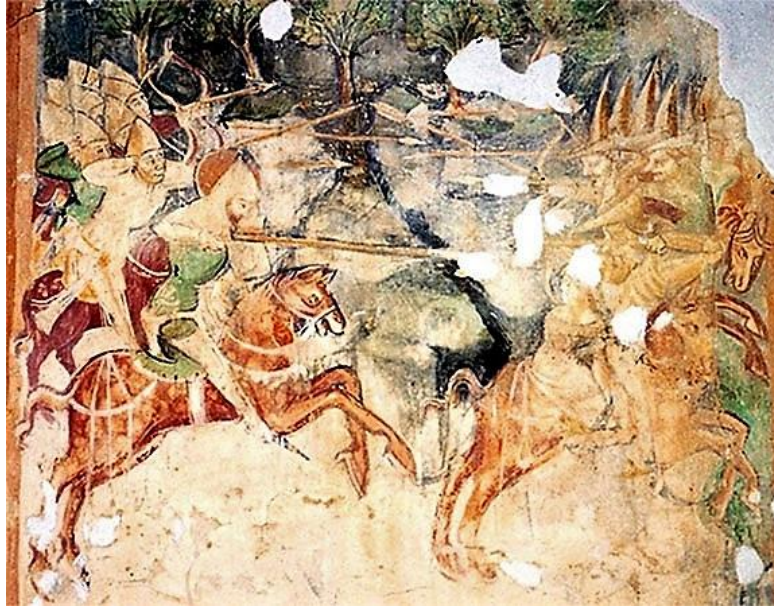
A bántornyai freskó. 223

A kor vegyes felszerelésű katonaságának emlékét őrzik, az íjat, mint a nyugati típusú nehézlovasság fegyverét megjelenítő freskók Bántornyán (Turnišče), Maksán (Moacşa), és Zsegrán (Zěgra). 224