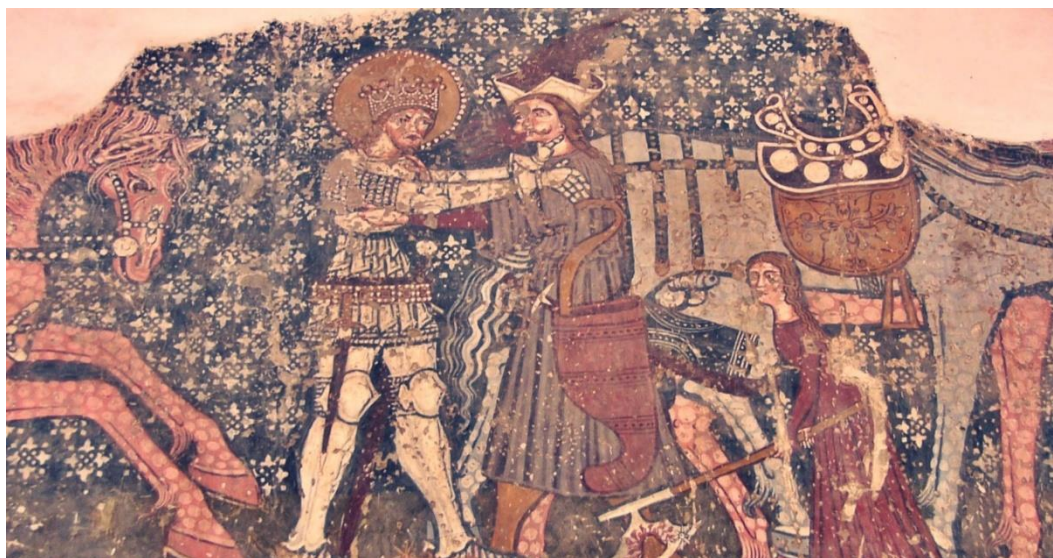
Freskórészlet a székelyderzsi templomban: Szent László és a kun vitéz birkózása. 241

A rimabányai (Rimavska Baňa) freskó tegeze is rokon darab, e példány lezáró teteje nem figyelhető meg pontosan. Anyaga eltérő, valószínűleg bőrből készítették. 240