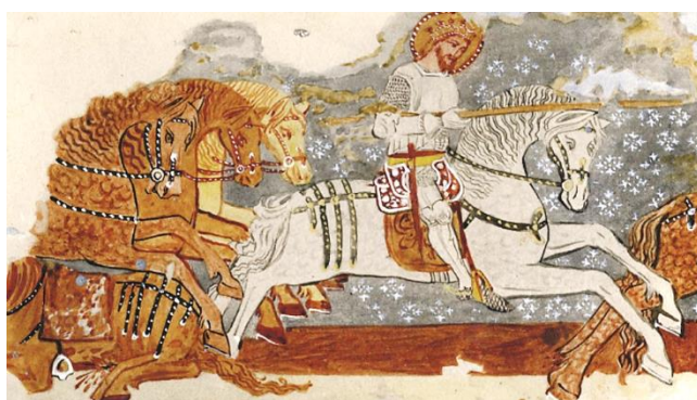
Freskórészlet a székelyderzsi templomban Szent László lovagkirály alakjával. 198

A magyar tudományosság már a 19. század második felétől kezdődően foglalkozott az ország legkülönbözőbb táján – elsődlegesen a peremterületeken fenn maradt – Szent László király legendáját bemutató középkori eredetű falképekkel.