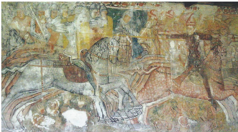
Rimabánya, Szent László-legendát ábrázoló freskó. 227

Érdekes az egykori kassai (Košice) falképen ábrázolt felajzatlan íj, amely a kun harcos övére (?) van függesztve. 226