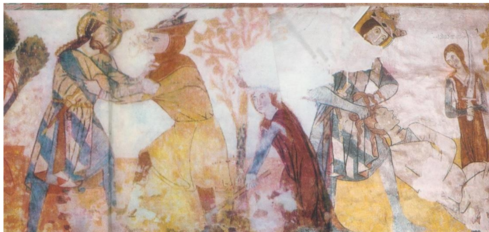
Kakaslomnic, jobbra a lefejezési jelenet. 215

A kakaslomnici (Vel'ka Lomnica) római katolikus templomban látható Szent László-freskó egyik jelenetén – „A kun lefejezése” – a megmentett magyar leány két kézzel emel fel egy szablyát. 213 E fegyver átmeneti típusként értékelhető, amely kard- és szablya jellegzetességekkel egyaránt bír. Bár a festmény stilizált, jól tanulmányozhatók a darab jellegzetességei: az erősen hajlított, széles, hegybe futó penge, egyenes kör keresztmetszetű keresztvas, tojásdad alakú markolat gomb. 214