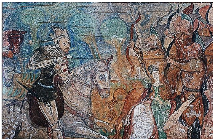
Zsegra freskója. 220

Az íjak között kiemelendők az úgynevezett reflex – vagy más néven összetett – íjak. Ez volt a honfoglaló magyarok fő fegyvere, de általánosan használták a 13–14. századi, a magyar sereg szerves részét alkotó nomád jellegű könnyűlovások – kunok, besenyők. E harceszközök rétegesen egymásra ragasztott szaru lemezből készültek. Az ív közepének és végeinek mindkét lapjára faragott csontlemezeket ragasztottak, majd azokat zsinórral erősen átcsavarva lekötötték. A megfelelő mértékben kidomborodó középső csontlemezpár feküdt bele az íjász tenyerébe, valamint az ív közepének merevítésében is szerepe volt. Az ív két végén elhelyezett csontlemezpárok a rugalmas ívrészt merevítették, de ezekben vájták az ideg beakasztására szolgáló csatornákat is. Magát az ívet úgy szerkesztették, hogy ajzatlan állapotában az egyenesen túl az ellenkező oldalra csaknem félkörívben visszahajlott. Felajzását követően az ezzel ellentétes oldalon alakult ki a félkör alakú ív.