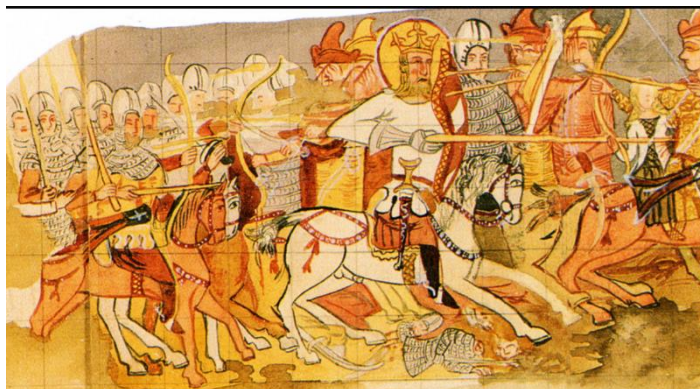
Erdőfüle freskója. 256

Így az erdőfülei (Filea) egykori festményen a kun harcos ruháját korong alakú díszítés borítja. A kép alkotója a kaftán anyagának díszítését próbálta érzé keltetni. 255