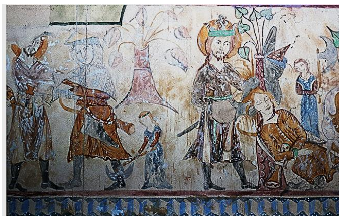
Vitfalva freskója. 250

A vizsgált időszakban nem beszélhetünk az újabb korban általános egyenruházatról, katonai viseletről. Feltételezhető, hogy egy-egy katonai vezető szűkebb csapata többé-kevésbé hasonló viseletet hordott. A kunok, besenyők, székelyek, illetve a szegényebb nép zöme ragaszkodott korábbi, keleties jellegű viseletéhez. A honfoglaló magyarok öltözetéhez nagyban hasonlító ruházat, így a tárgyalt korszak végéig fennmaradt a magyarországi népesség egy részénél. Ezzel szemben hódított a nyugati jellegű divat is. A kortársak mindig jól elkülönítették ábrázolásaikon e két fő típust.