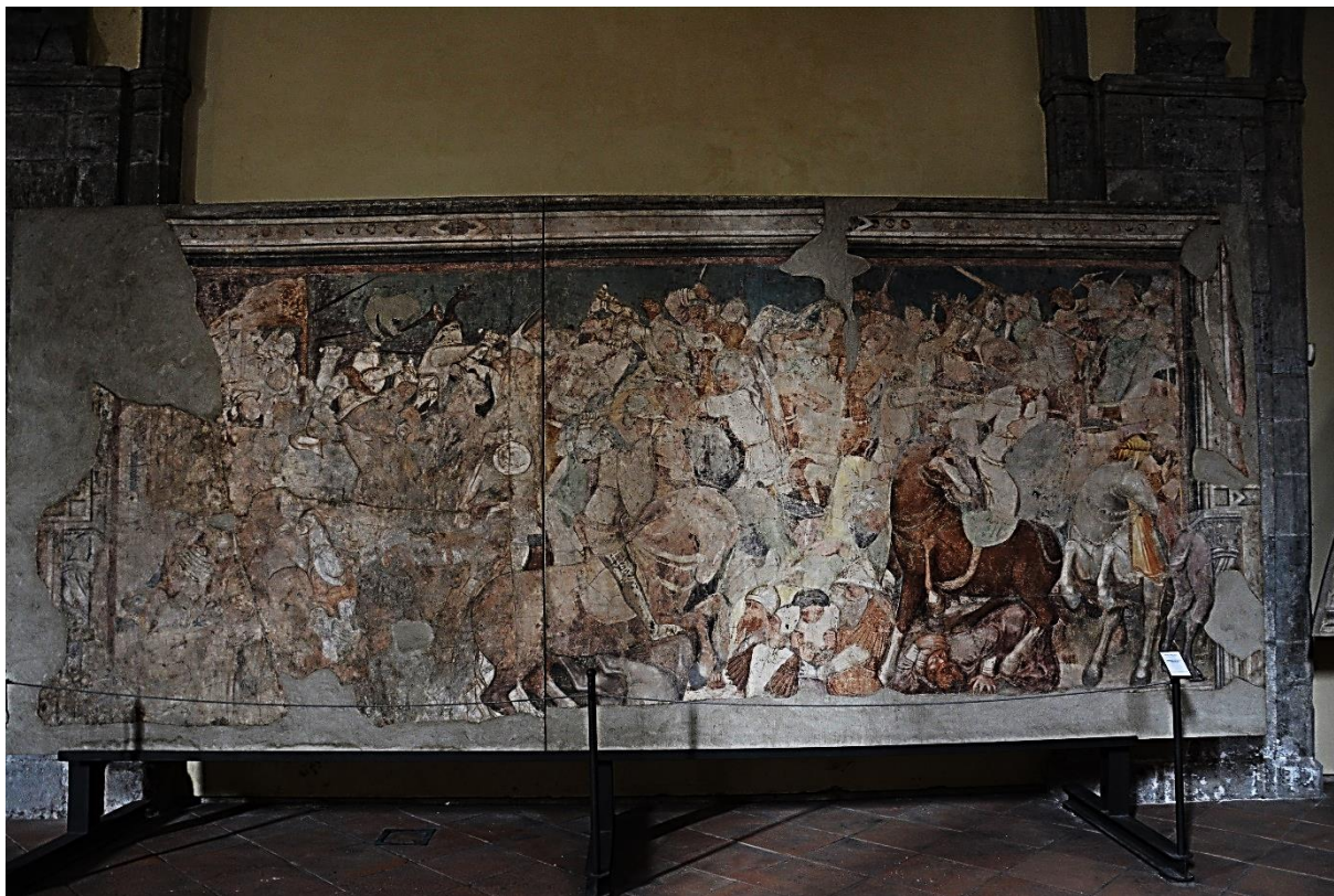
A nápolyi Santa Maria Incoronata templomban Szent Lajos csatája az úzok ellen freskó. 204

főúri-, nemesi családok birtokolták, illetve a középkorban fontos világi és egyházi központnak számítottak. 203