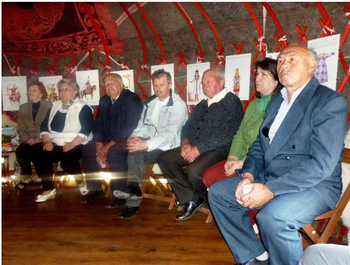
A jurta közönsége