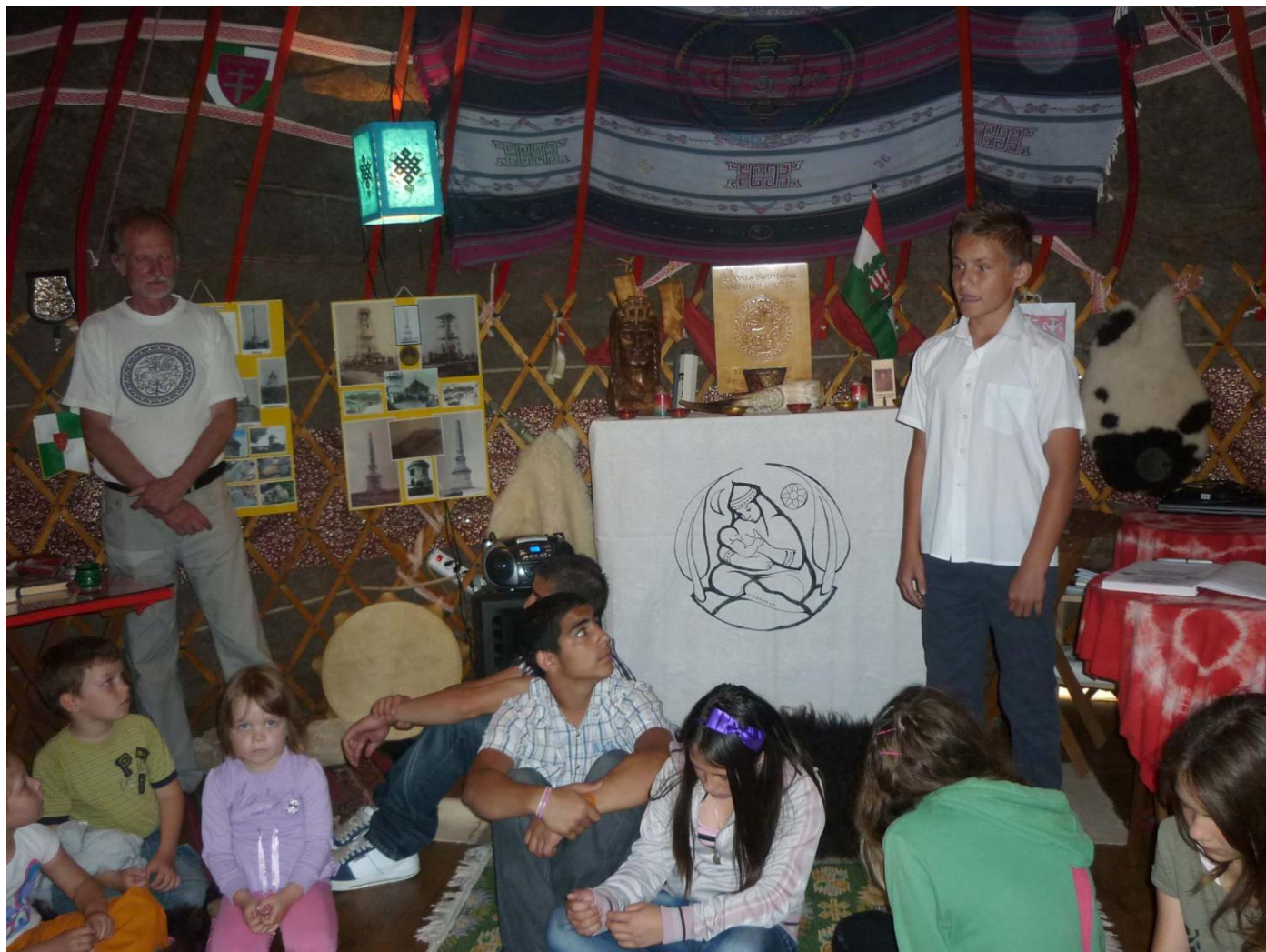
A jurta közössége

Igazán kedves és szép rendezvény volt, köszönet a házigazda egész családjának.