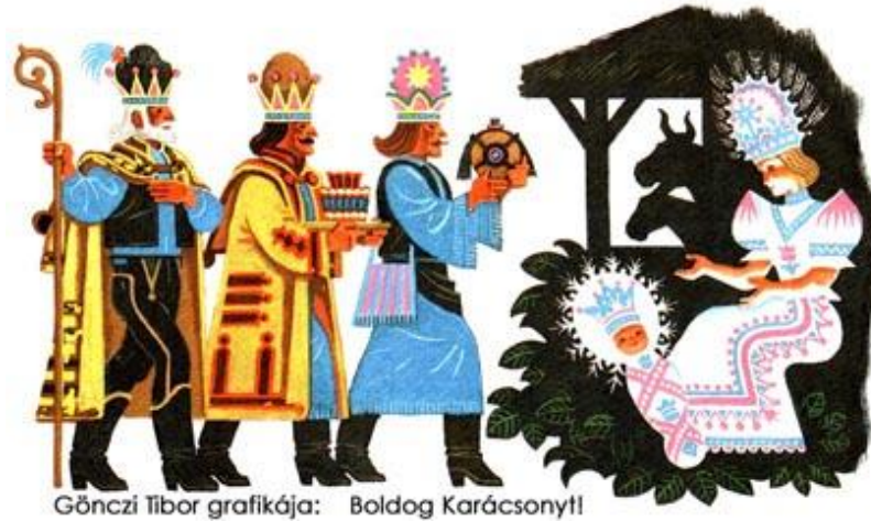
Gönczi Tibor grafikája: Boldog Karácsony!!