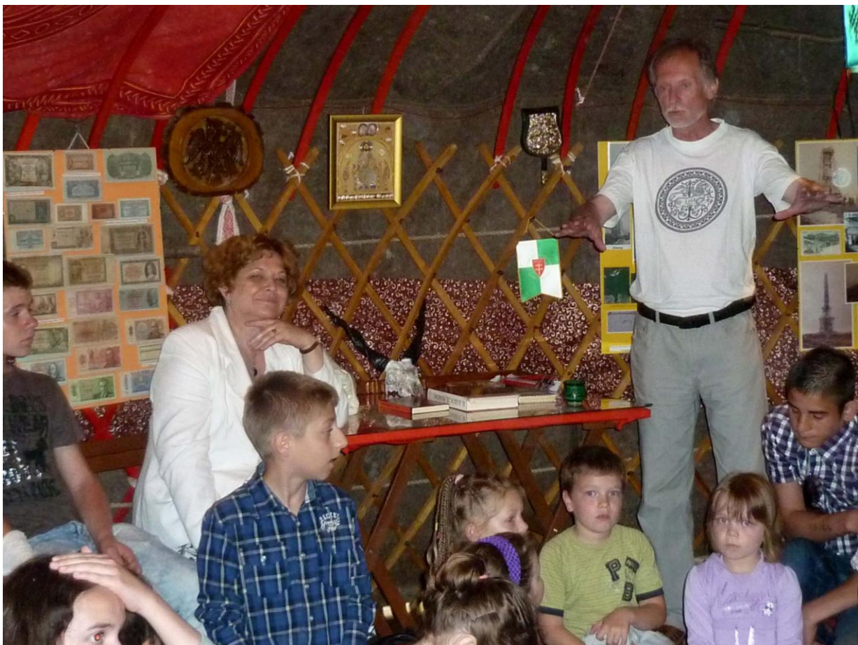
A jurta közönsége