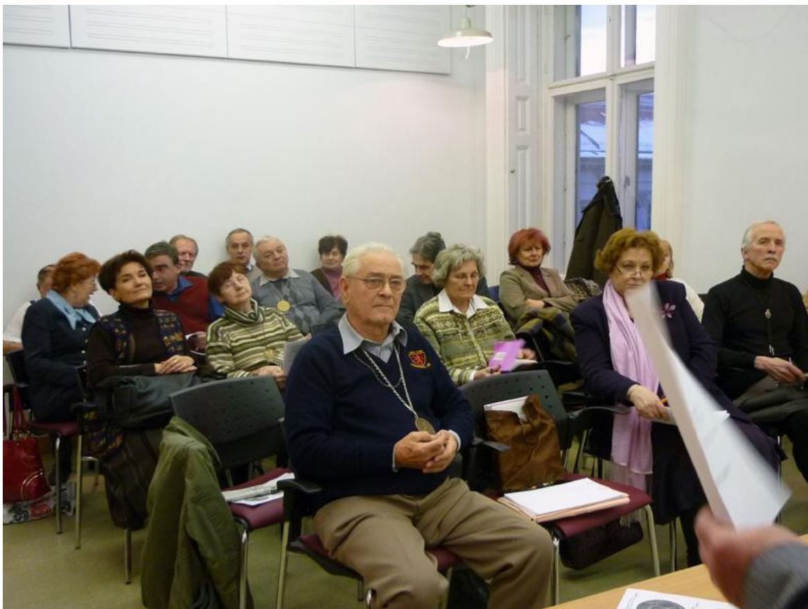
Az előadás közönsége