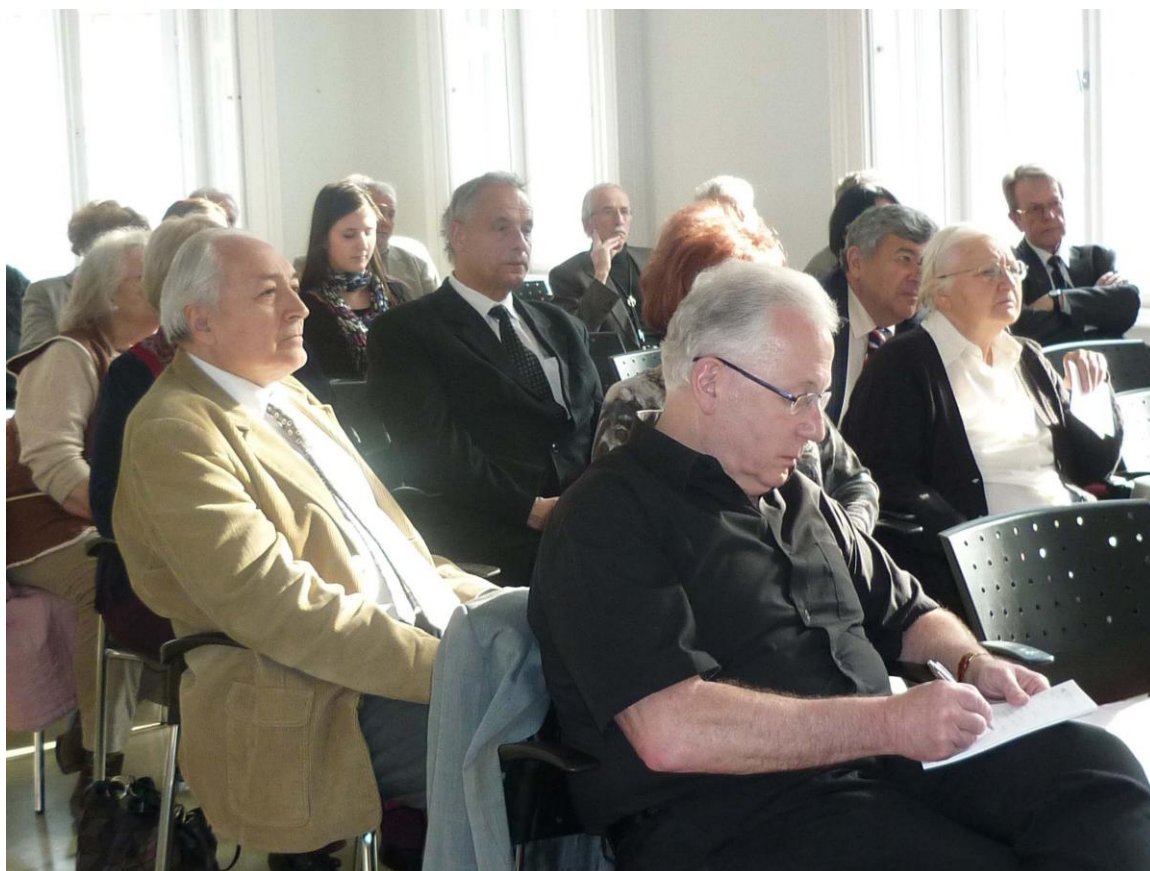
Az előadás közönsége