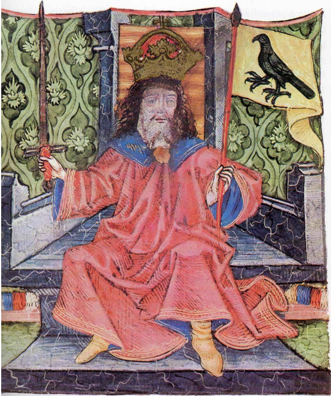
Atila a Thuróczy Krónikában, Kr. u. 1488

Nem állítom, de megengedem, hogy – egyebek mellett – azért is nem találjuk Atila sírját, mert akik eltemették titokban hagyták nemcsak a sír helyét, hanem a valódi nevét is annak, aki abban a sírban nyugszik. Priszkus retor és az idegenek csak azt hallották, ezért így elterjedt és így jutott, majd maradt emlékezetünkben az Ő neve.