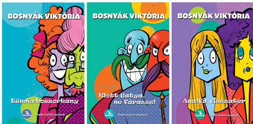
Az újraillusztrált Tündérboszorkány -trilógia borítói