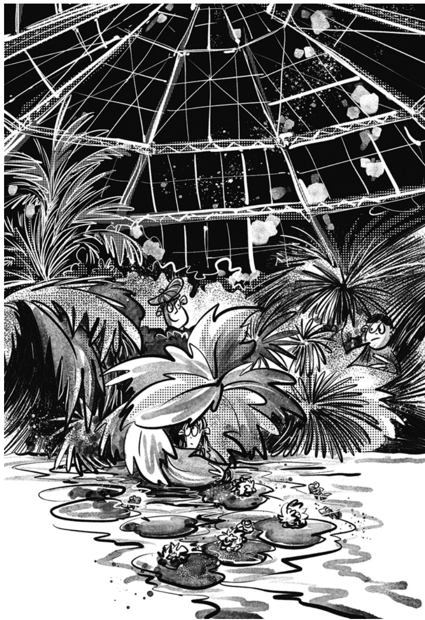
Az újrajllusztrált A Pál utcai fiúk