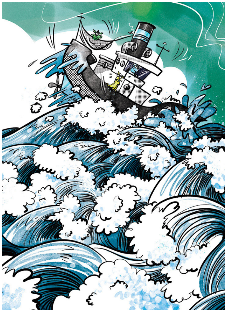
Illusztráció A cseles bálnales című kötetből

meg, ráadásul az ő munkáit nagyon szeretem. Eleinte direkt kerültem, hogy megnézzem, más hogyan rajzolta meg, de aztán rájöttem, hogy fölösleges: úgyis a saját stílusomban alkotok. Most már bármilyen könyvet elővehetek anélkül, hogy ez nyomást gyakorolna rám.