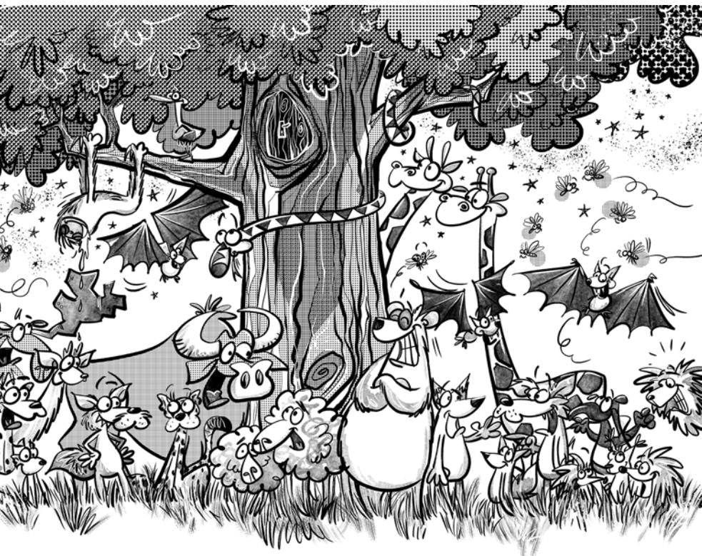
Részlet a Két bolond százat csinál című kötetből

hogy a stílusa nagyon is kedves, mondhatni „édes”. Rengeteg díszítés van benne, a színei cukorkaszínek, és mégsem giccs, sőt!