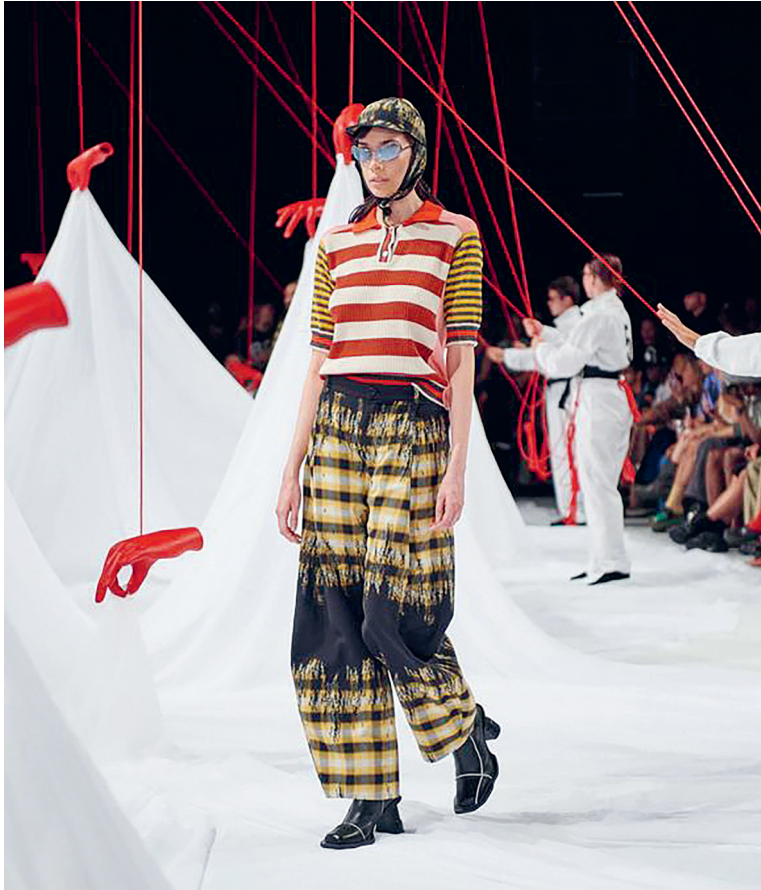
3. ábra. Henrik Vibskov The Orchestra of the Soft Assistance című 2025-ös tavaszi-nyári kollekciónak az emberi kezek segítőkészsége és az állatvilág csodás alkalmazkodóképessége inspirálta.

A bemutatkozó divatcégeknek a körkörös tervezés elveit kell alkalmazniuk. Alapvető követelmény a javíthatóság, az újrahasználatosság, a fejleszthetőség, az inkluzív, széles méretskála, valamint az adaptív, a fogyatékkal élőket is figyelembe vevő designszemlélet. Az anyagok tekintetében a jövőbeni alapanyaghiányból indultak ki, és meghatározták, hogy a felhasznált alapanyagok legalább 60%-ának vagy tanúsítvánnyal kell rendelkeznie, vagy gyártásból megmaradt (deadstock)