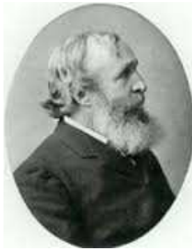
Charles Loring Brace

"It was my fortune to visit Hungary just after the revolution. It is an interesting though mournful experience, never to be forgotten, to stand by the death-bed of a nation. Here was a people, educated by a thousand years of constitutional liberty, having risen gradually above feudalism, until, in 1848, the last vestige of serfdom and caste was swept away, accustomed to such freedom as no country in Europe but England has enjoyed, a noble, gallant race, suddenly trodden down under absolute despotism. Liberty of speech, liberty of press gone; ... national schools, national churches broken up; the old language even forbidden in public documents, and their dear old colors of the kingdom outlawed; the favorite songs of Hungary sung – as were the songs of Zion – by stealth 'in a strange land' under fear of the law; the fields wasted, and the homesteads burned; the prisons filled with suffering patriots, and scaffolds red with their blood. Such was the sad picture that then met my eye." As his daughter wrote, he did not write many letters from Hungary, knowing they would be censored by the Austrian authorities. In Vienna, he had met