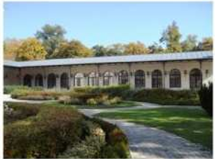
Anna Grand Hotel 1-2 épület szárnya, Anna Grand Hotel 3. épület szárnya, Anna Grand Hotel 4.épület szárnya, a mai Anna bálók helyszíne, Anna Grand Hotel árkdjai, a balatonfüredi Pantheon