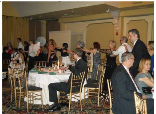
Photos of the 61st Café Budapest Ball