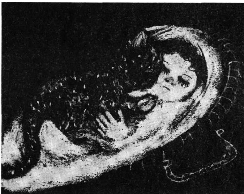
A magányosan sétáló macska (ill.: Szántó Piroska)

feldolgozás, rendszerszervezés, rendszerfejlesztés, menedzsment) szolgálja a szakmára való felkészítést. Az új elképzelés tartalmazza a kétszintű képzésnek megfelelően a B.sc. (alap) diploma és a M.sc. (mester) diploma megszerzésének feltételeit. A kreditrendszerre történő áttérés (ha általánossá válik a hazai felsőoktatásban) megkönnyíti a differenciált szakmai igényekre való felkészítést, továbbá, egyes korábban hallgatott stúdiumok beszámításával a képző intézmények közötti átjárást, mely jelen körülmények között rendkívül nehézkes.