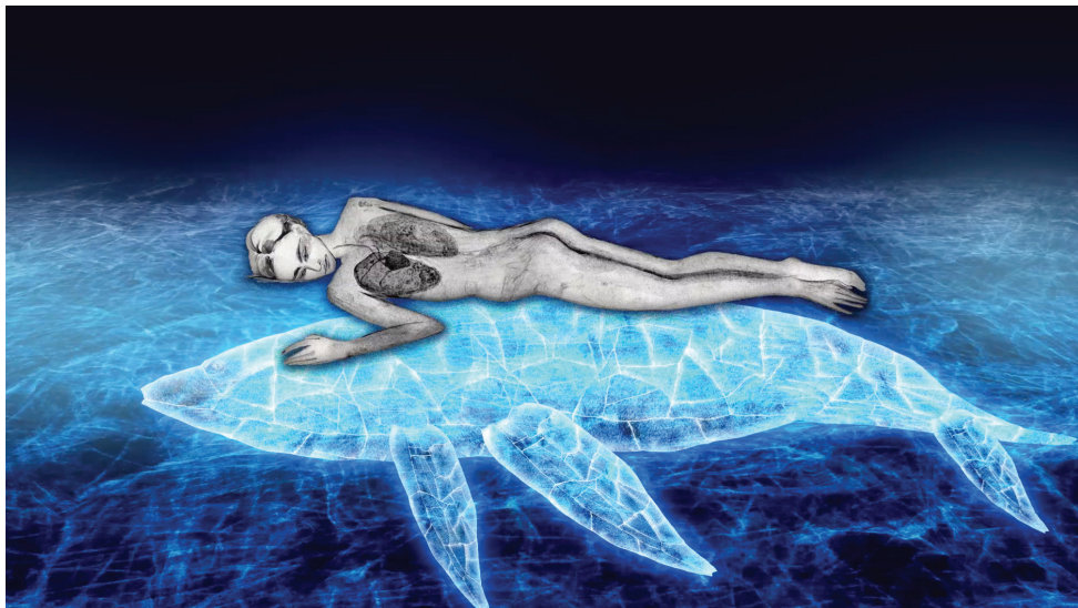
Last Days of Quana, 2022 (1920×1080 px, 2D kollázs, animáció kézi rajzokból).