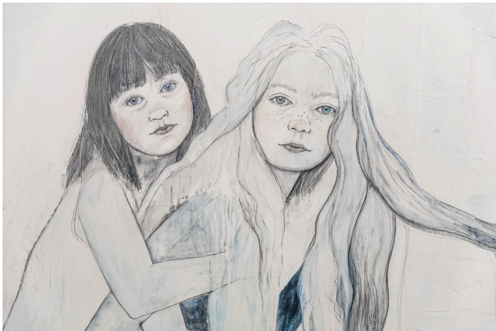
Gyerekek fegyver nélkül-sorozat (Rozi és Natália), 2025 (rajz, vakolat, fatábla, 120×145 cm).