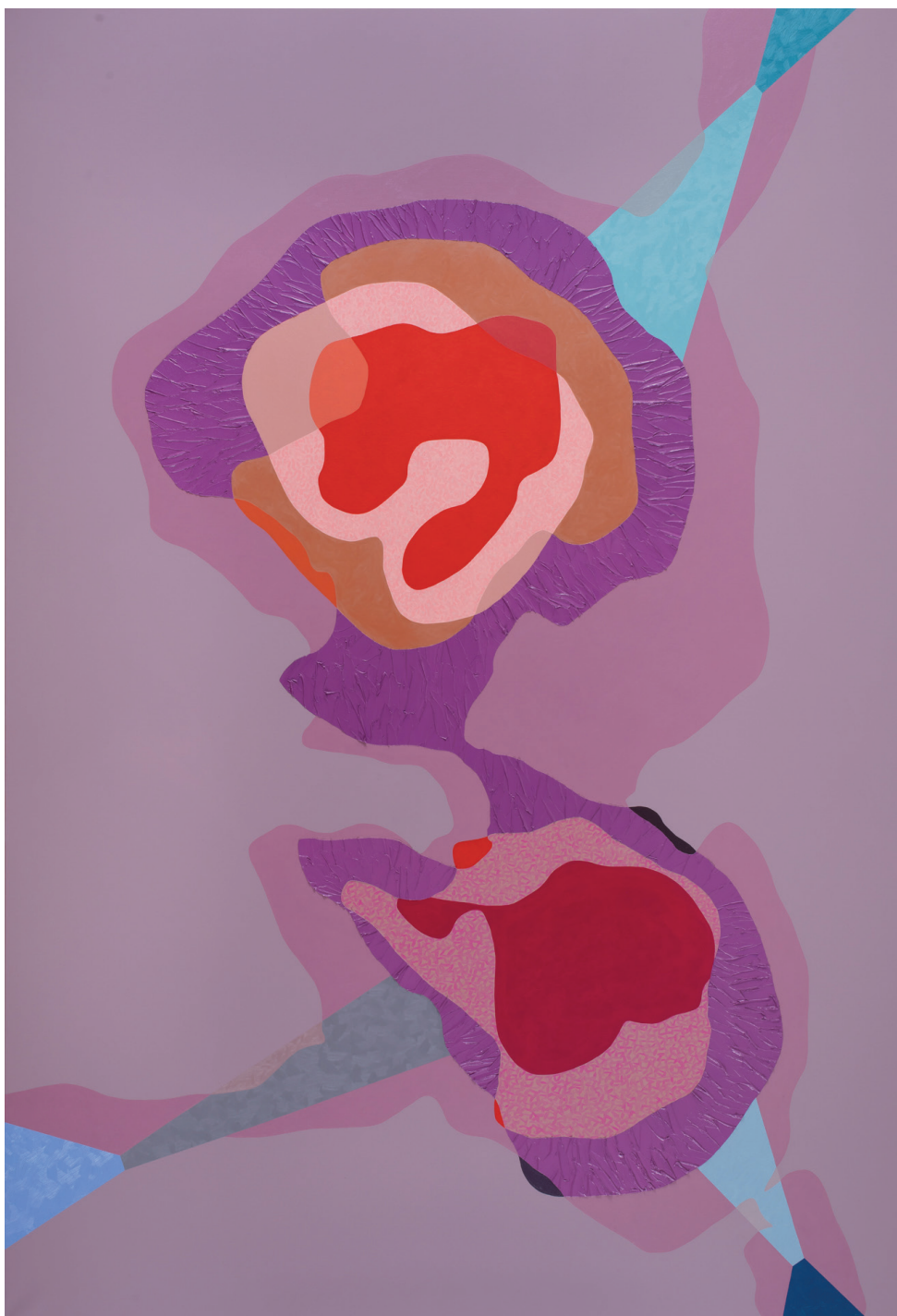
Barabás Zsófi: Csak csönd, 2019 (olaj, akril, vászon, 220×150 cm)