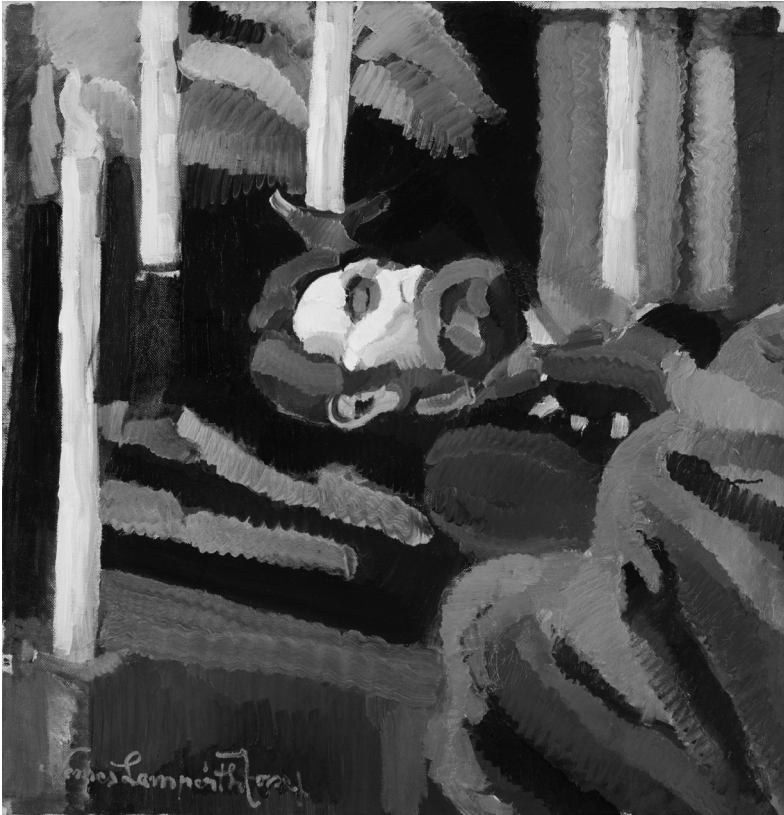
Nemes-Lampérth József: A ravatal, 1912 (olaj, vászon, 90,8×87,4 cm, Szépművészeti Múzeum—Magyar Nemzeti Galéria), © Szépművészeti Múzeum, Budapest