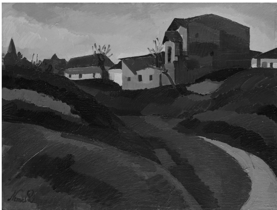
Nemes-Lampérth József: A Gellérthegy lejtőjén , 1917 (olaj, vászon, 76,5×101 cm, Szépművészeti Múzeum—Magyar Nemzeti Galéria)