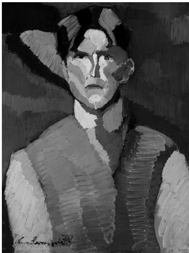
Nemes-Lampérth József: Önarckép , 1911 (olaj, vászon, 75×60 cm, Szépművészeti Múzeum–Magyar Nemzeti Galéria)

(Gonda László: Németh Géza szolgálata. Misszió kereten kívül. Bp., 2023, Méry Ratio Kiadó.)