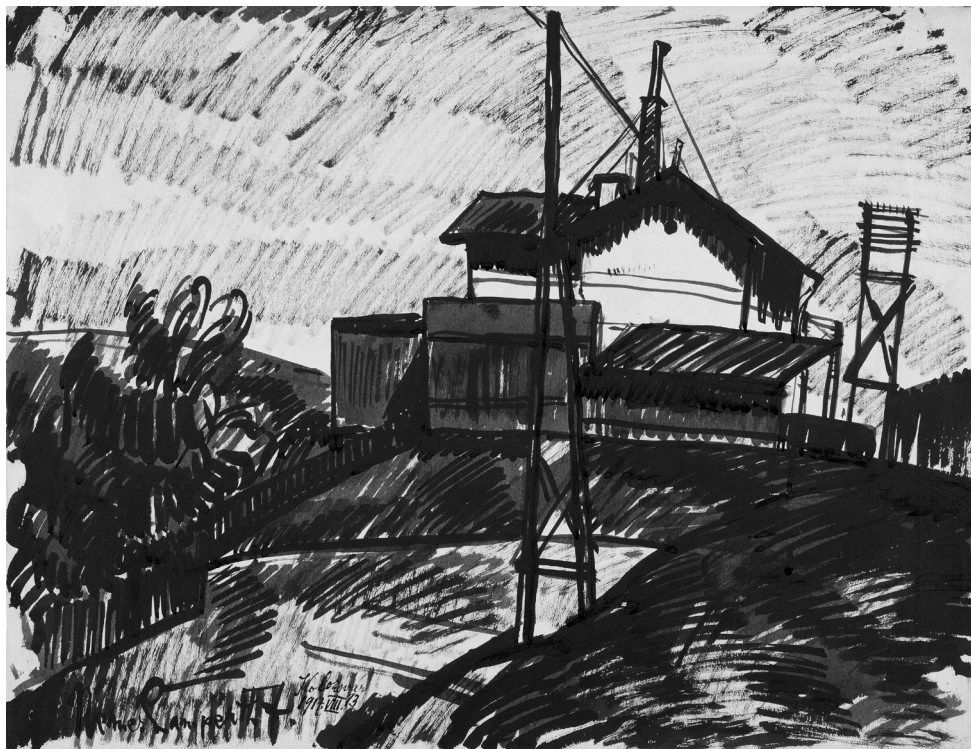
Nemes-Lampérth József: Kolozsvári állomás, 1917 (tus, karton, 503×655 mm, Szépművészeti Múzeum—Magyar Nemzeti Galéria), © Szépművészeti Múzeum, Budapest

Májusban megújult a borlap. A nő kért egy pohár furmintot. A kerthelyiség leghátsó sarkában egy idegen pár ült. A férfi épp desszertet rendelt, a nő még nem tudta, hogy alig fél óra múlva az egyik szép kéz, a cipzárját rángatja, a másik pedig befogja a száját. Nevettek sokat, és időnként a nő a férfi kezét nézte.