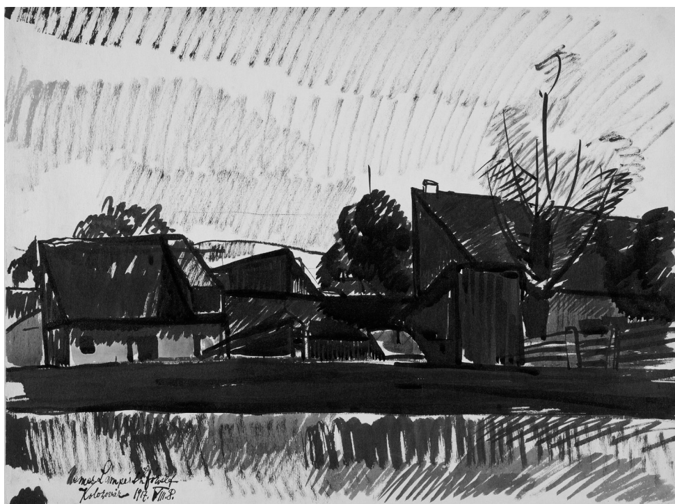
Nemes-Lampérth József: Falusi házak, 1917 (karton, tus, ecset, 494×655 mm, Szépművészeti Múzeum—Magyar Nemzeti Galéria), © Szépművészeti Múzeum, Budapest

Ma álmaimban újra Abonyban jártam én, ki ismerős volt régről eljött ismét elém, és boldogan fogadtak első szerelmeim, mind ötven felé járt már a ráncaik szerint, és újra felidéztük a rég elmúlt időt, mikor még rájuk vártam az iskola előtt. Csattantak első csókok, kamaszként így szokás, de hát elmúlt már mindez: lettünk anyák-apák. Ti is régi barátok, ti nagyra nőtt fiúk, kikkel a nádist jártuk, és mindig volt kiút, ti is ott voltatok, és köztetek ott voltam – így vártatok ma rám a messze tűnt Abonyban.