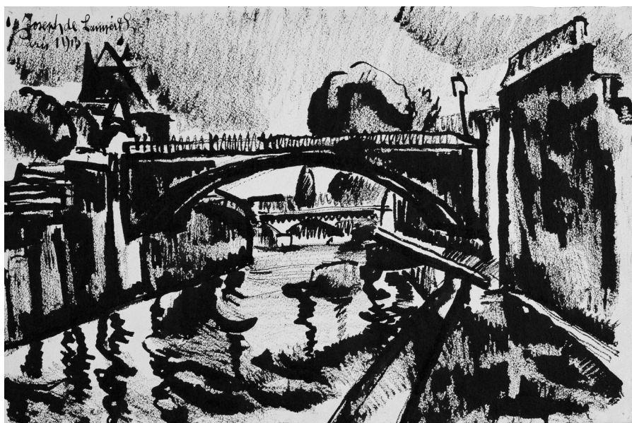
Nemes-Lampérth József: Szajna híd, 1913 (tus, papír, 330×500 mm, Szépművészeti Múzeum—Magyar Nemzeti Galéria)

régi valójában idejétmúlt kérdés kínoz még mindig a sebek sokáig bírnak emlékezni nincs kifutási idejük miért és hogyan jutottunk oda ahova jutottunk kevés voltam a boldogságodhoz kellett valaki más aki hajlandó és képes is minden áldozatra érte megbocsátának már de nem tudok mert nincs kinek és nem is lehet hiszen a szerelem nem bűn csak a hazugság a szükséges rossz ami aláaknázza életünket az elgömbült válaszok a félresikló tekintet mikor már csak temetni lehet nem megbocsátani vagy újramezdeni hiszen életünk nem csak egyetlen csalódáshoz elég