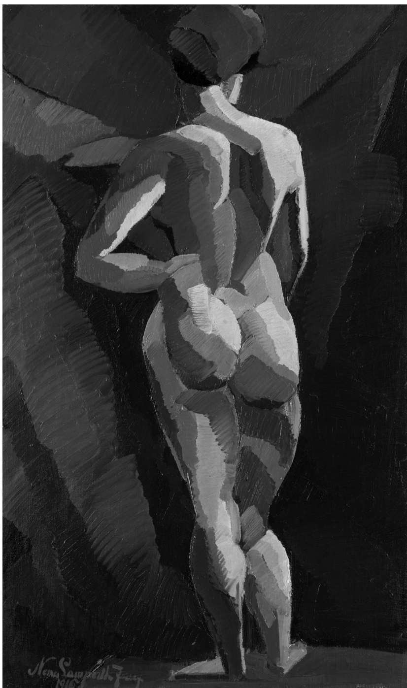
Nemes-Lampérth József: Háttal álló női akt, 1916 (olaj, vászon, 130,5×80 cm, Szépművészeti Múzeum—Magyar Nemzeti Galéria), © Szépművészeti Múzeum, Budapest