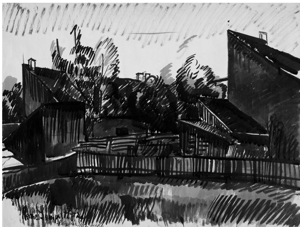
Nemes-Lampérth József: Kolozsvár, 1917 (papír, tus, ecset, 495×655 mm, Szépművészeti Múzeum—Magyar Nemzeti Galéria), © Szépművészeti Múzeum, Budapest

Az őszi ág-bordái közt hullanak a levelek, a szél beszélget velük. Tollászkodnak, madárként repülnek el.