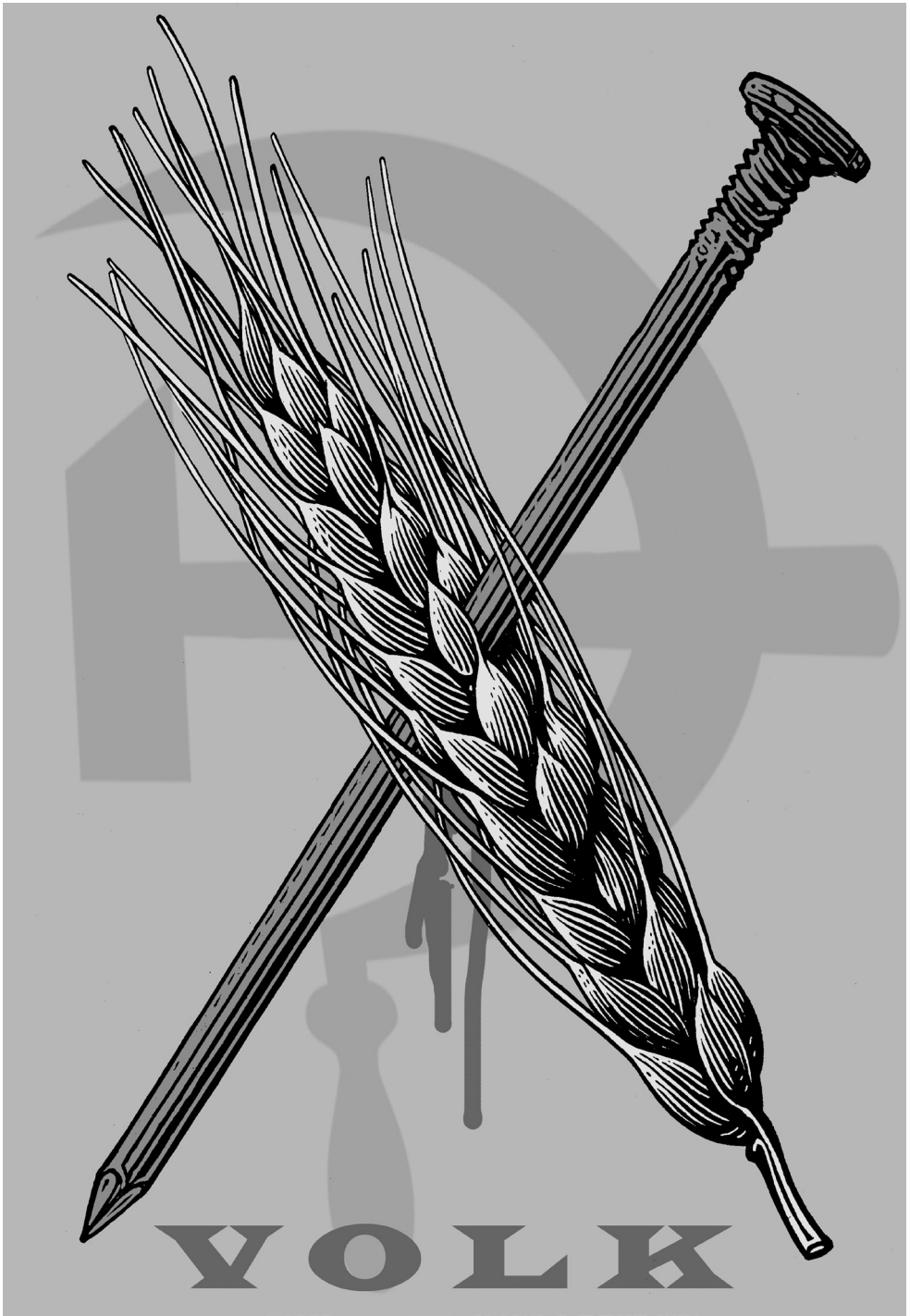
Orosz István grafikája