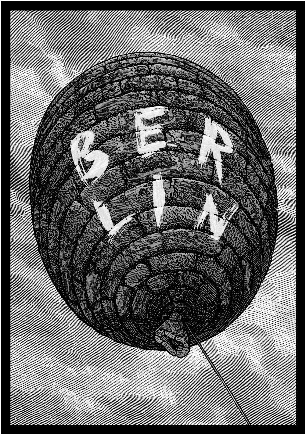
Orosz István grafikája