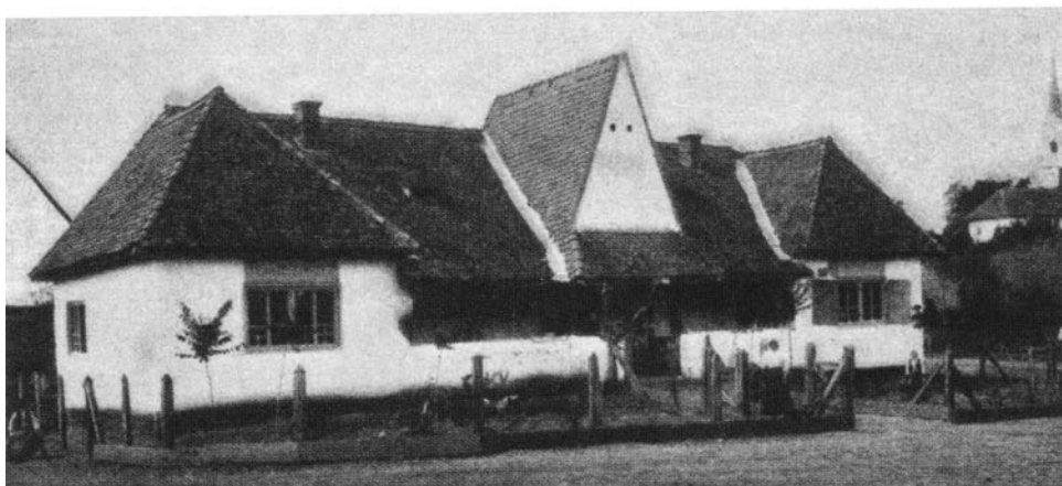
Harasztkerék, népház, 1909