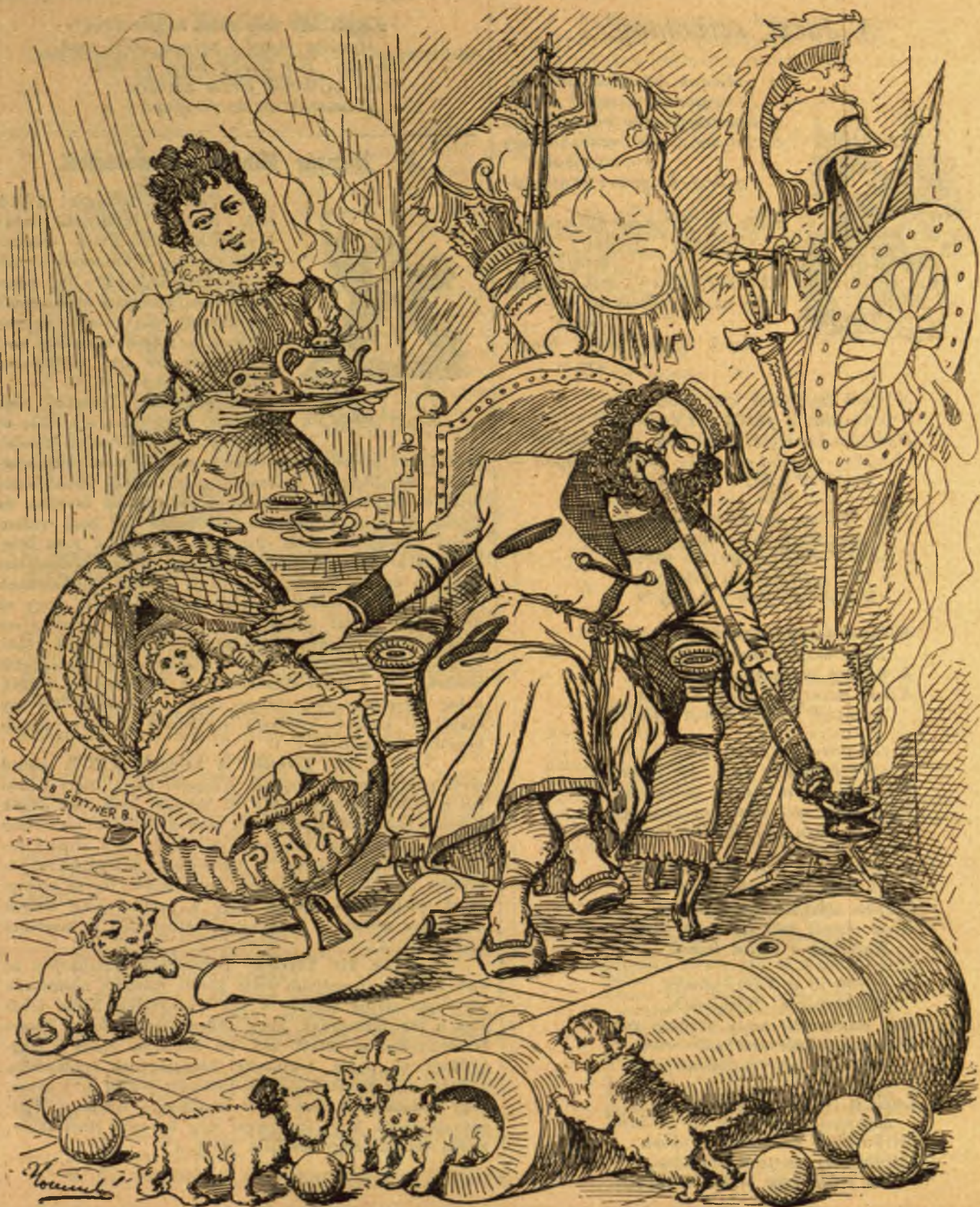
A lefegyverzés után.