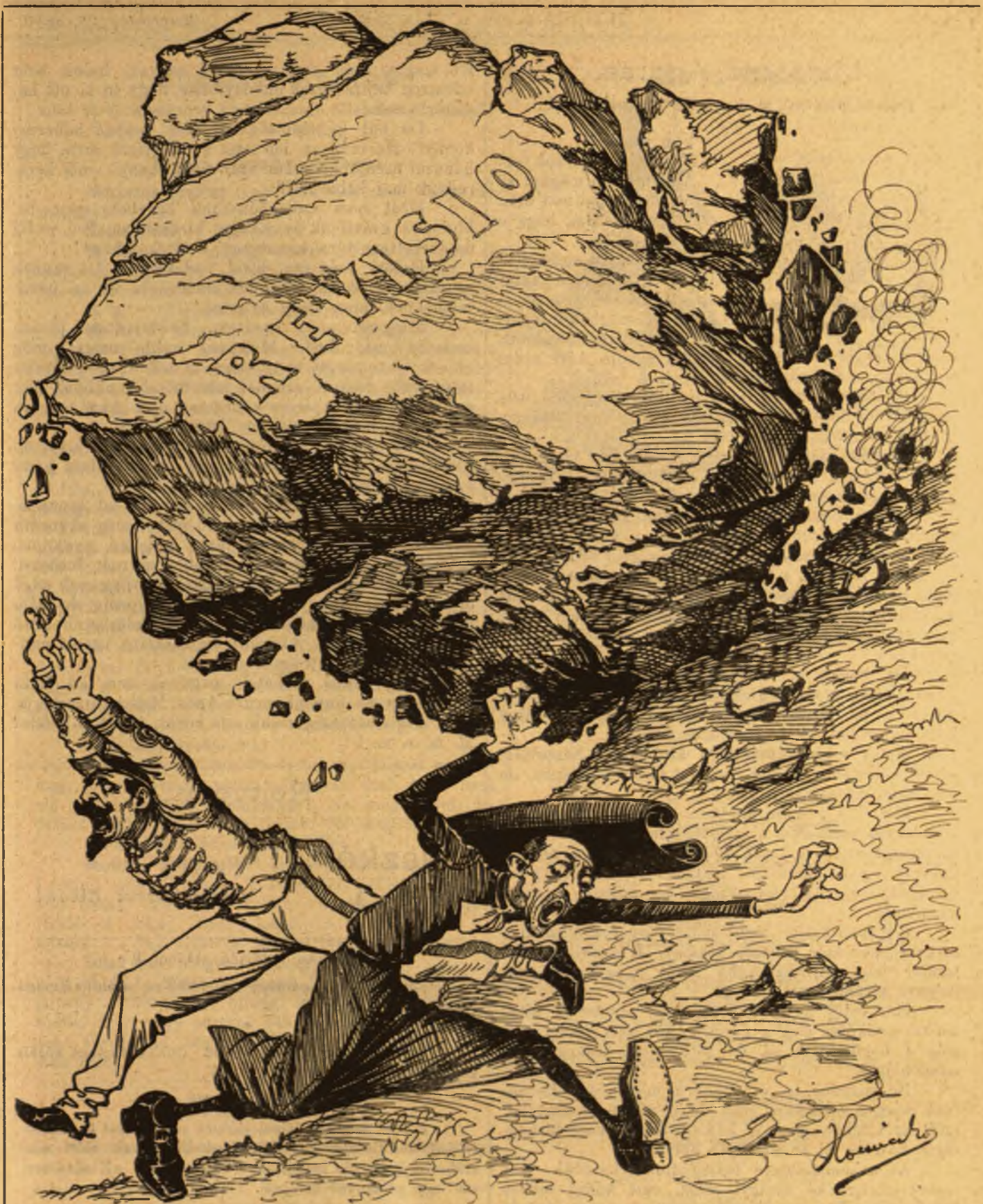
A megmozdult kő.