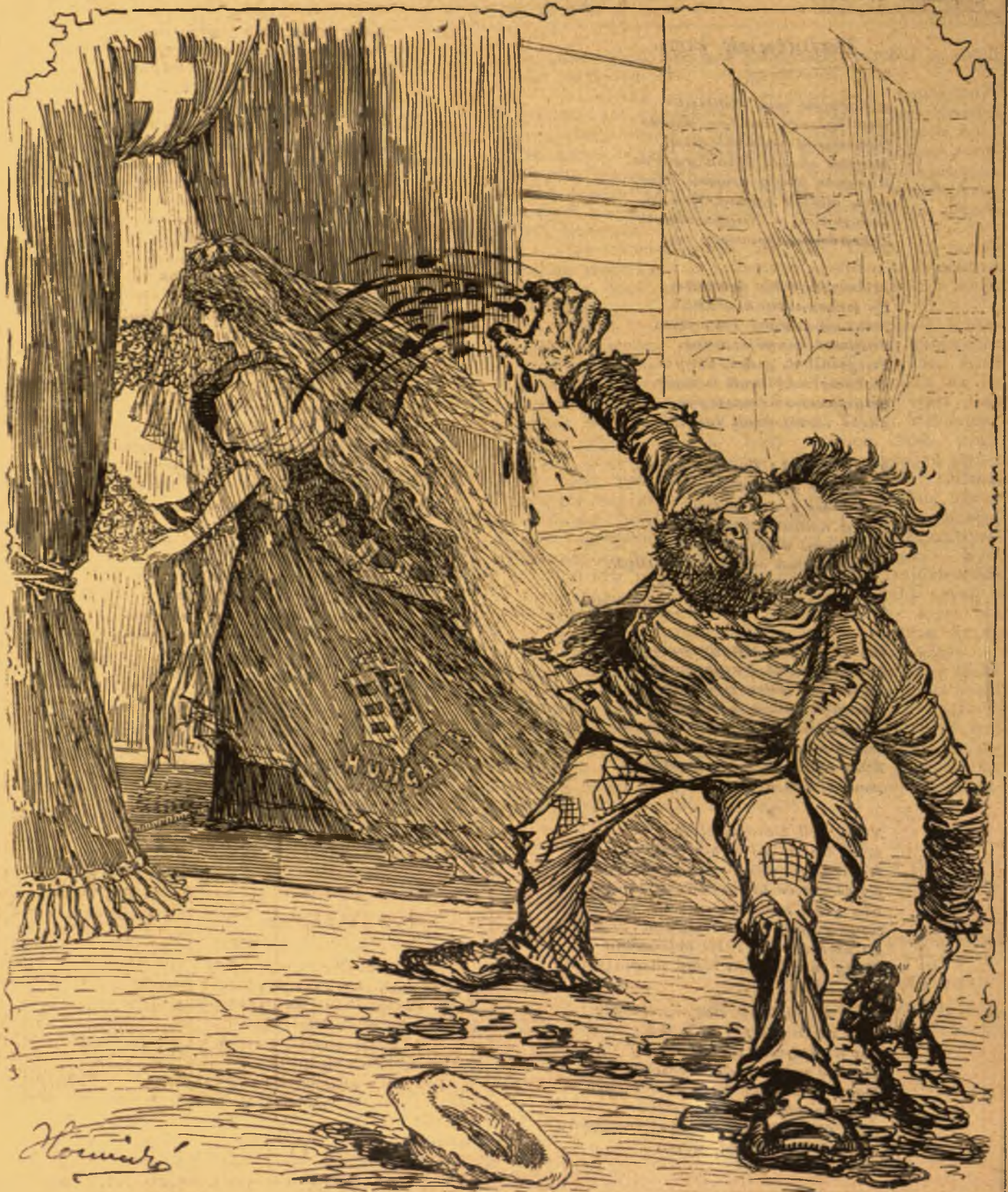
— a bécsi gyász.