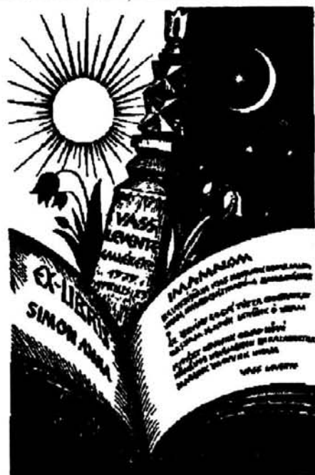
Csutak Levente: Ex libris