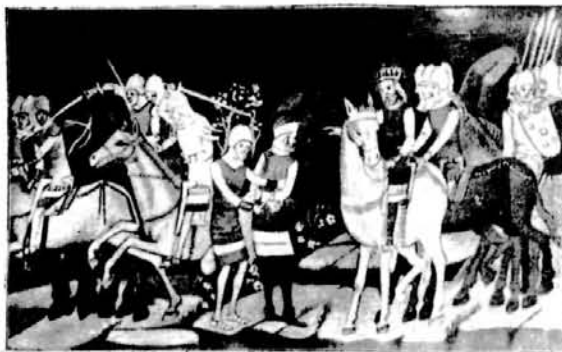
Szent István harca Gyulával

„A magyar mitológia ősi mítoszi eredeti elemekre mutat. Közel az emberiség eredetéhez,