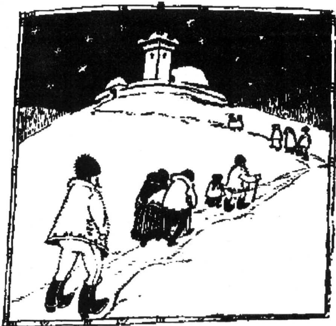
Kós Károly rajza