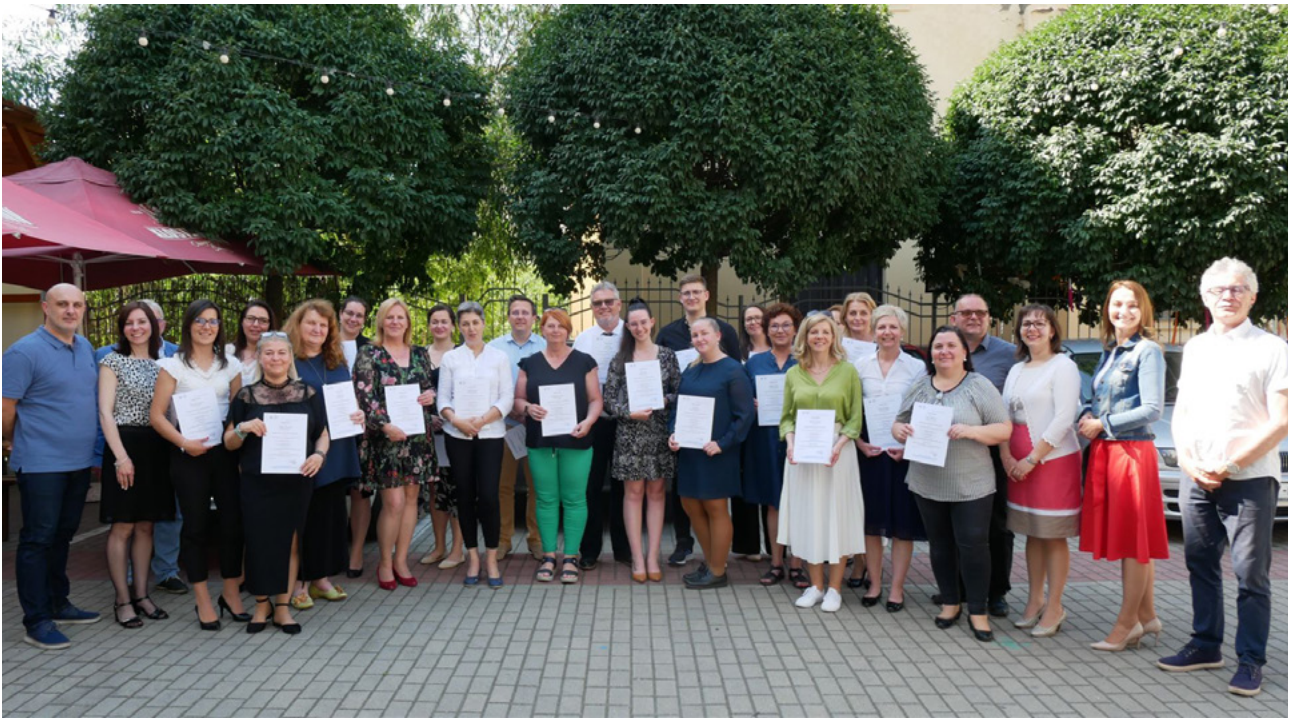
Intézményvezető képzés - Debrecen