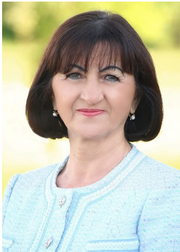
Szekeres Katalin polgármester

„Csatlakozzon mindenki bátran ehhez a szép és nemes célhoz!” – mondta a polgármester mosolyogva – „Minden fáradozást megér az emberek arcára kiülő boldogság az előadások után, minket színészeket, társulattagokat pedig büszkeséggel és kimeríthetetlen energiával tölt fel a hétköznapiakban. Ez a legszebb cél.”