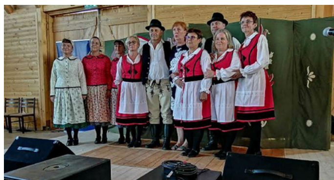
Kékesei Amatőr Színjátszó Társulat

A kutatás eredményei azt is mutatják, hogy a helyi színi-játszás nemcsak művészeti értéket teremt, hanem erősíti a közösségek belső kohézióját és a generációk közötti kapcsolatokat. Továbbá ezek a hatások tovább gyűrűződnek, így a segítő hálózat is erősödik, a kultúra iránti elkötelezettség magasabb szinten van jelen és számos együttműködést generál. A Pajtaszínház Program közösségi dimenziója messze túlmutat a színház falain: a résztvevők számára a kreativitás, az összetartozás és a helyi identitás építésének kiemelkedő forrásává vált. E Program támogatása nemcsak a színházkultúra, hanem a vidéki Magyarország közösségi jövőjének szempontjából is megkerülhetetlen.