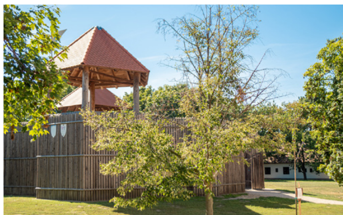
Hazáért körút

Emellett a Gárdonyi Géza irodalmi sétány is megtalálható az Emlékházhoz vezető úton. Agárdon az Almárium termelői piac és kultúrpark várja a kikapcsolódni vágyókat.