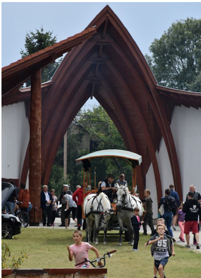
Dinnyési Hagyományörző Központ

A Gárdonyi Géza Könyvtár és Kulturális Központ 2010-ben jött létre, alapítója és fenntartója Gárdonyi Város Önkormányzata. Alapító okirata szerint hat telephellyel lát közművelődési feladatot és kulturális turisztikai szolgáltatást, ezek a következők: Nemzedékek Háza, Agárdi Községi Ház, Dinnyési Templomkert és Hagyományörző Központ, Gárdonyi Géza Emlékház, Velencei-tavi Galéria, Gárdonyi rönkvár, illetve a Klausz Gábor Városi Könyvtár.