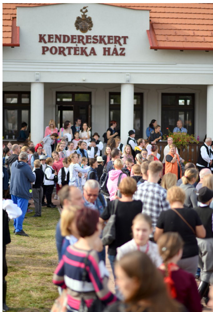
Kendereskert Portéka ház