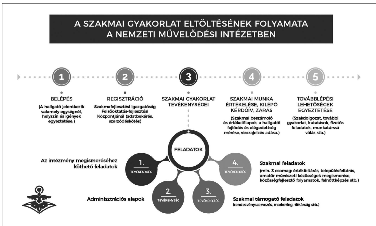
4. ábra: A szakmai gyakorlat folyamata a Nemzeti Művelődési Intézetnél

folyamatosan bővülő meghatározó személyeket bemutató oldalt. Kérjük, hogy lapozzák, nézzék, használják.