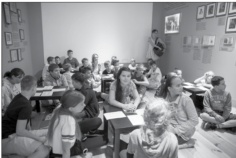
Rendhagyó irodalomóra Kápolnásnyéken