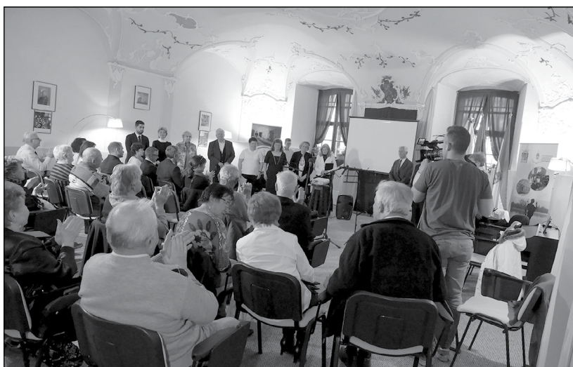
Versbarátok program Tatán

– közösségfejlesztés, közösség-szervezés módszerei