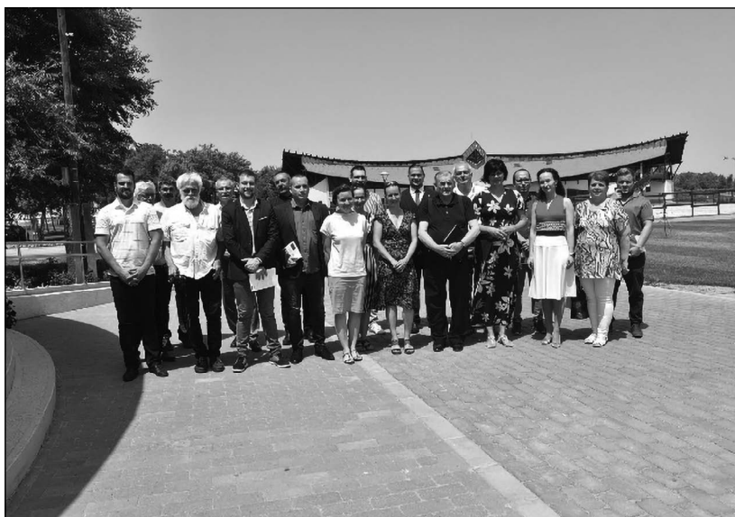
A hálózat megalapítói Lakiteleken 2021 nyarán

Ilyen a Kárpát-medencei Művészeti Népfőiskola Kápolnásnyék központtal, vagy a bakonyi erdőben megbújó Királyszállás tematikus Nagy-Magyarország Parkja. Vagy éppen a Kárpát-medence egyik legkeletibb szélén, Kovásznán kialakí-