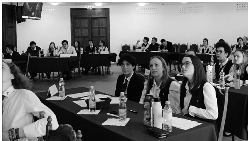
Hungarikum vetélkedő Lakiteleken

(pl. képzések, tréningek, tanfolyamok, konferenciák, kollégiumok, szabadegyetemek, vándor-egyetemek, tanulmányutak, vetélkedők, kirándulások, tapasztalat-cserék, kiállítások, ismeretterjesztő és ismeretszerző alkalmak)