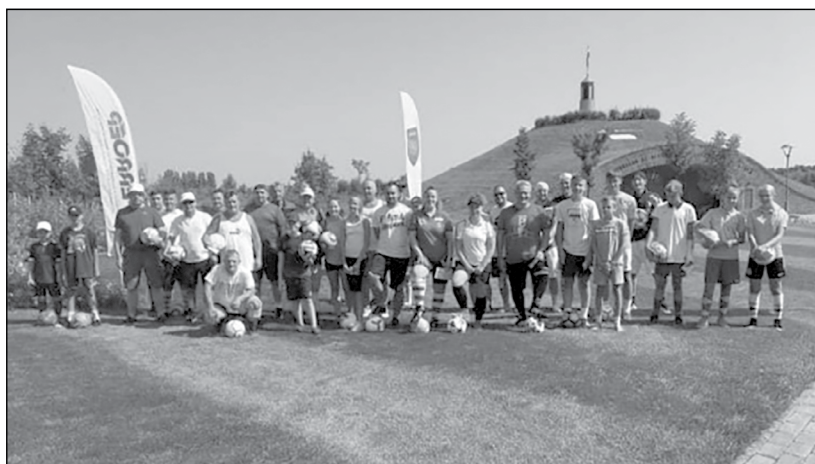
Footgolf verseny Lakiteleken

tékfeltáró kollégiumok módszere, amely többfordulós szociológia felmérés kérdőívvel, interjúkkal. Ugyanakkor képzés, közösségépítő tábor is egyben, amelynek kereté-