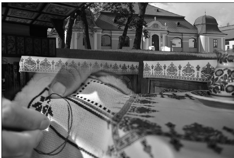
Beregi keresztszemes és a Beregi Múzeum