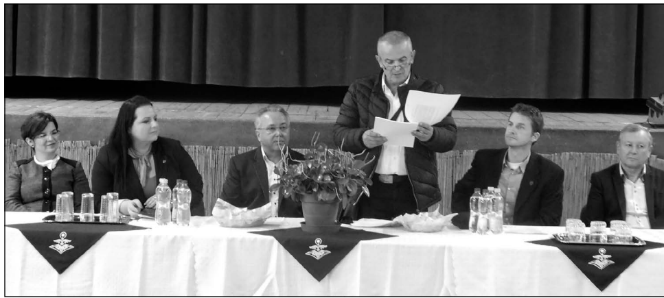
Szamosháti Tájegységi értéktár konferencia

A Nemzeti Művelődési Intézet „ Otthonról haza ” – Kulturális kapcsolatok erősítése a Kárpát-medencében projekt keretében