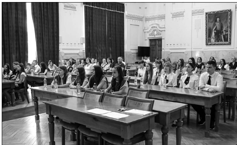
Értékes barangolás vetélkedő

általános és középiskolák számára. A vetélkedősorozatban fontos szerepet kap a megyei értéktár és a megyei kötődésű hungarikumok. A verseny egyik legfontosabb célja, hogy a közös megyei értékek megismerésével a fiatalok identitástudatát erősítsék. A döntőben egy különleges feladatot is kaptak: be kellett mutatniuk, és a bizottságnak ajánlaniuk egy leendő értéket. Ennek köszönhetően több érték úgy került be a megyei kincsesládába, hogy a tanulók javasolták a vetélkedők feladatainak megoldása során. Ez az értékőrző program a kistelepülések ifjabb korosztályát szólítja meg. A fiatalok számára a program lehetőséget kínál hasonló érdeklődésű fiatalokkal való együttlétekre, közös szabadidős programokra, a saját településük mélyebb megismerésére, a helyi identitás erősítésére, a közösséghez való tartozás érzésének átélésére. Mindez egybefonódik az egész életen át tartó tanulásnak a lényegi elemeivel, hiszen lehetőséget nyújt nem formális kör-