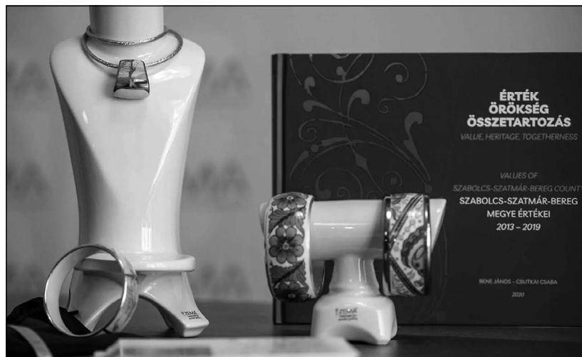
Érték – Örökség – Összetartozás