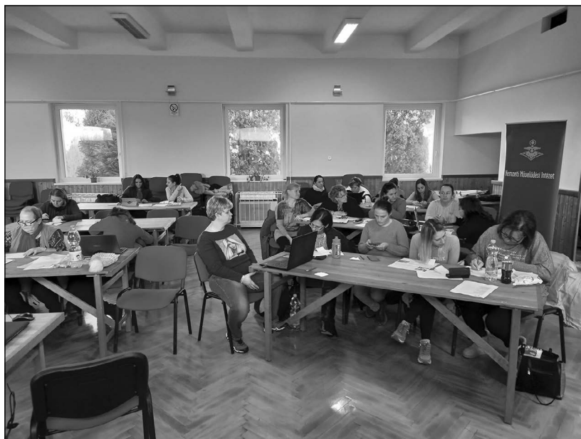
Nagykanizsai szakmai nap

Gyorsan körvonalazódott, mely településeken lesz sikeres az elmúlt évnek köszönhetően a beágyazódás és mely településeken várhatóak hiányosságok. Azokon a településeken, ahol úgy ítélték meg, hogy kell egy szakember, aki a lakosság kulturális életének szükségleteivel foglalkozik, borítékolt volt a siker. Azt, hogy az újonnan képzett kollégák pályán maradnak-e, sok minden befolyásolja, többek között, hogy milyen kapcsolatot tud kialakítani a településen, kiegyensúlyozott-e az együttműködése a település vezetőségével, képes-e a szakember a megszerzett tudást a gyakorlatban is alkalmazni.