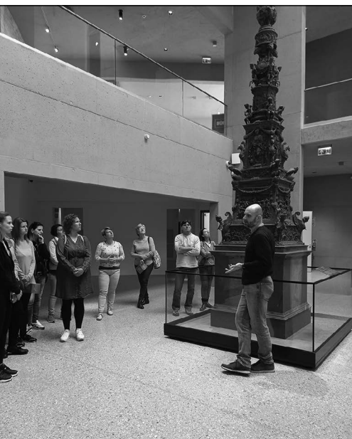
Komáromi erődben márciusban