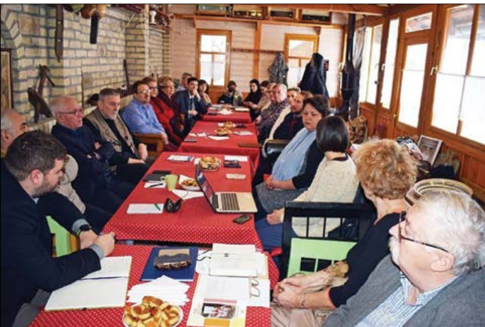
A Kárpát-medencei Közművelődési Kerekasztal 2019-es, zentai megbeszélése

vonni az adott régióban, odatalál az egyénekhez – maga is a hálózat része és a hálózatosodást építi.