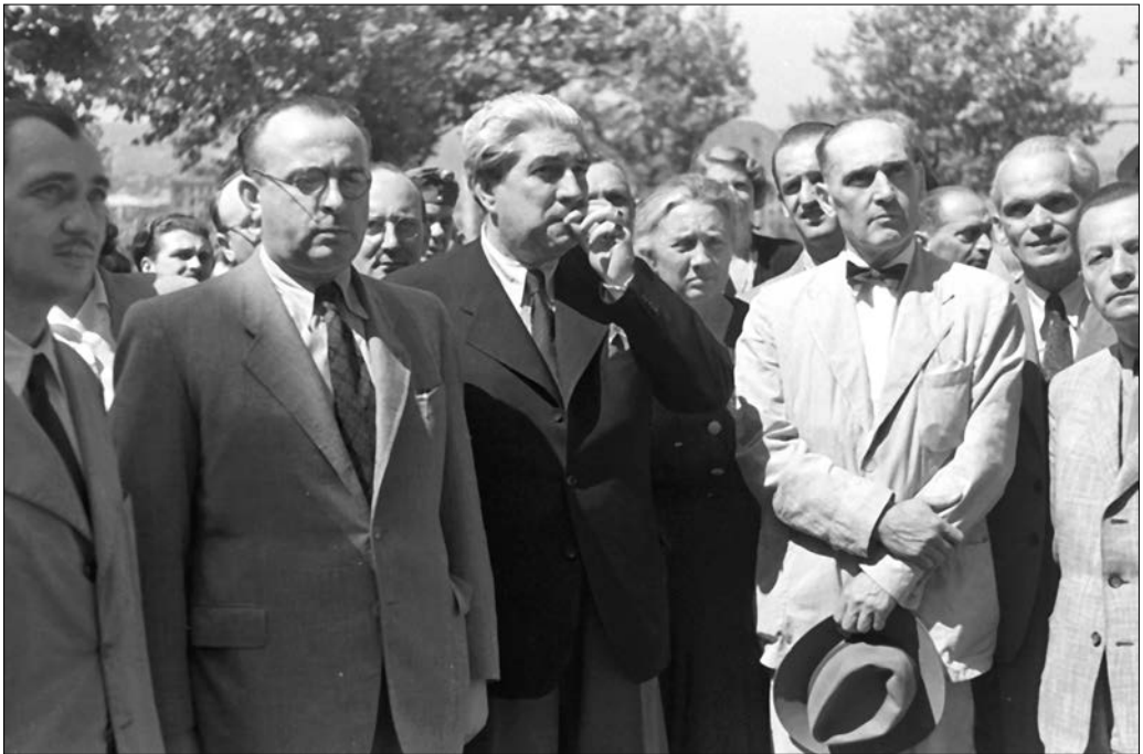
Budapest V. Kossuth Lajos tér. A felvétel a 18. számú épület, az Egyesült Államok katonai missziójának székháza előtt az amerikai magyarok gyógyszerajándékának átadásakor készült. Balról a második Vas Zoltán a főváros polgármestere, a harmadik Zsedényi Béla az Ideiglenes Nemzetgyűlés elnöke, középen takarásban Kéthly Anna a Magyar Vöröskereszt társelnöke. Kalappal a kezében Arthur Schoenfeld követ, a Szövetséges Ellenőrző Bizottság amerikai missziójának vezetője, tőle jobbra takarásban Gyöngyösi János külügyminiszter, jobb szélén Molnár Erik népjóléti miniszter, 1945.