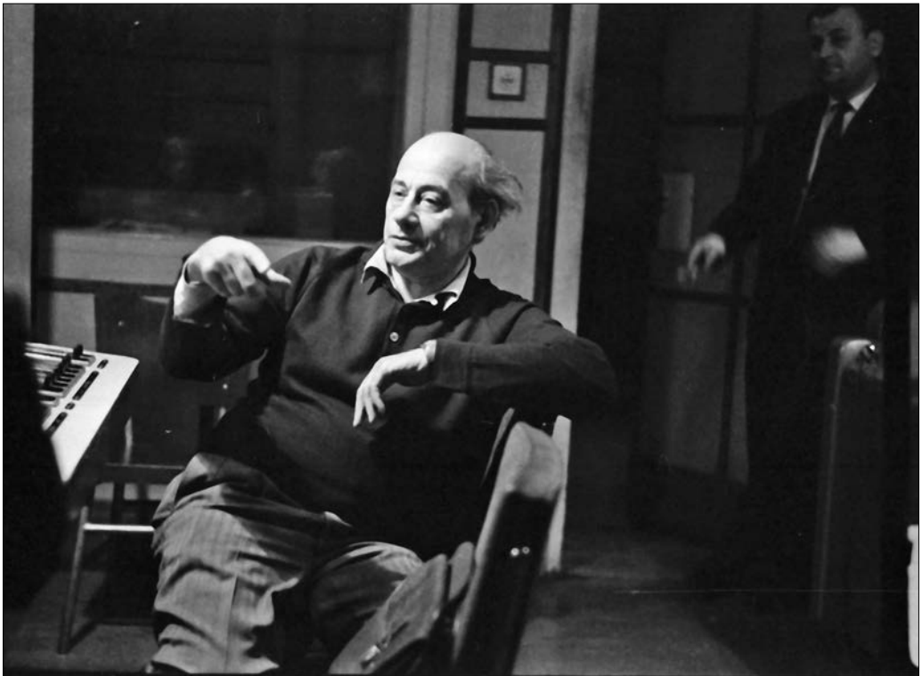
A Magyar Rádió stúdiója Tamási Áron író Énekes madár című székely népi játékának rádiófelvételén, 1963.