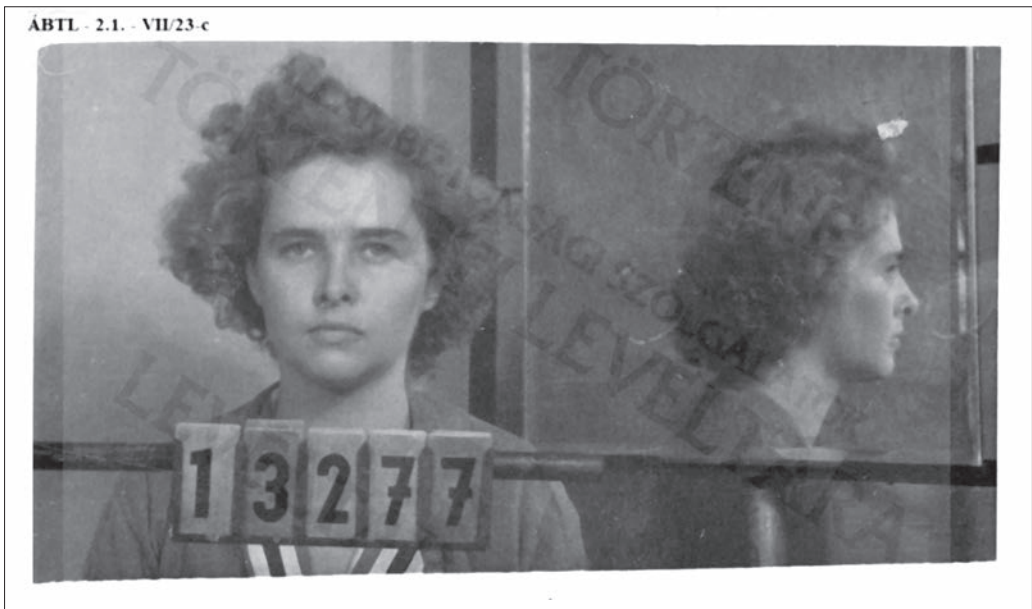
3. kép. Vizsgálati fogságban, 1951.

Két és fél hónapos vizsgálati fogsága elején tagadni próbált, ám a zárkaügynök ezt jelentette róla: „Elmondotta azt, hogy férjét védeni kívánja, nem akarja kiszolgáltatni a hatóságoknak, annál is inkább, mert fél tőle, és ha a vallomásokat összeegyeztetik, férje nagyon könnyen rájöhet arra, hogy ő nem a megbeszélte dolgokhoz tartja magát, és ez rá rossz fényt vethet. [...] Nincs az a felső hatalom, ami rákényszerítené őt arra, hogy mást mondjon, mint amit férjével otthon előre megbeszéltek.” Abban is nagyon bízott, hogy külseje átlendíti a bajokon. 58 Ezek után erőszakot is alkal-