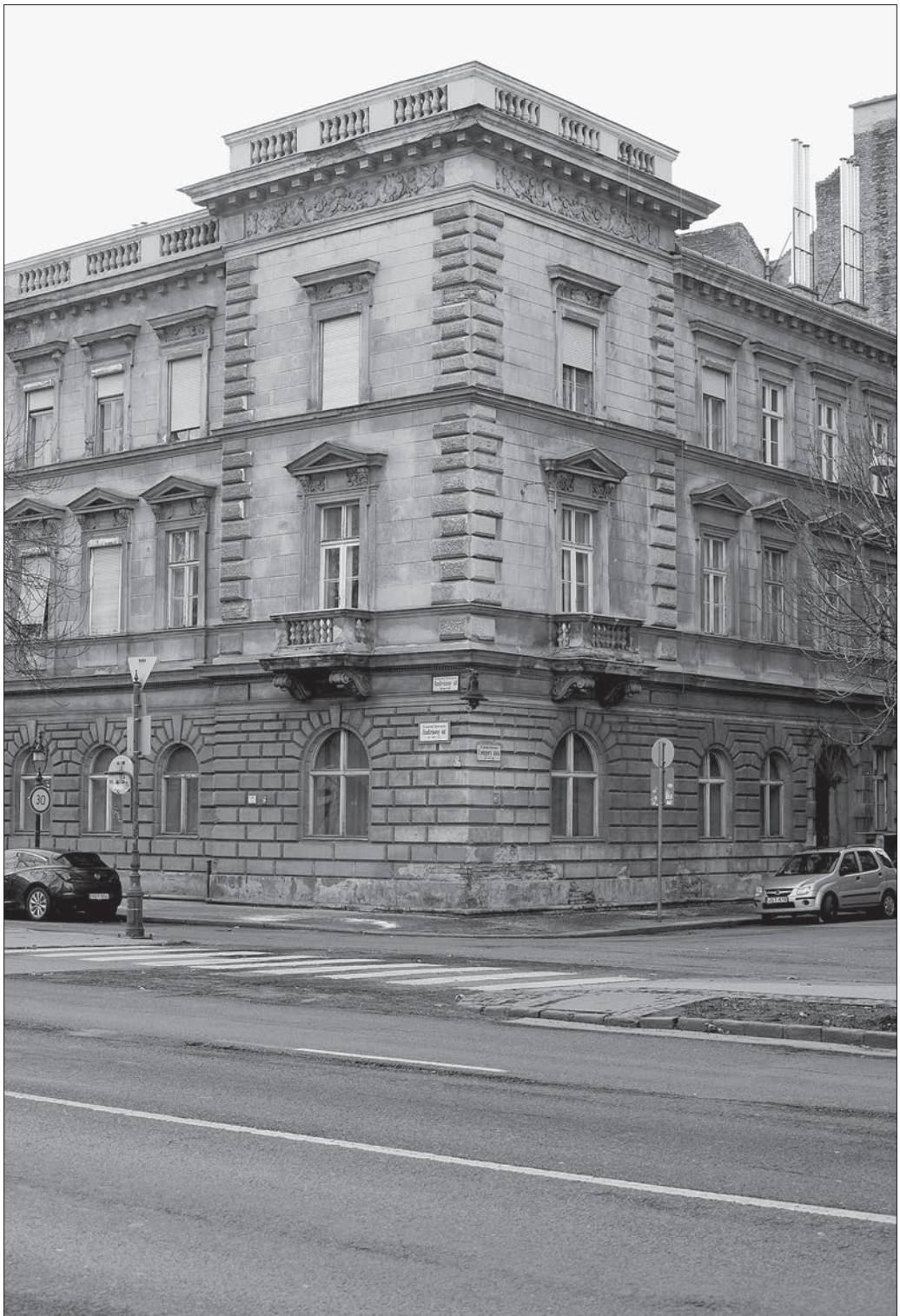
Andrásy út–Csengery utca sarok

Fotó: Kovalovszky Dániel ÁBTL III. - 2.24. - I.s. - 28.21.