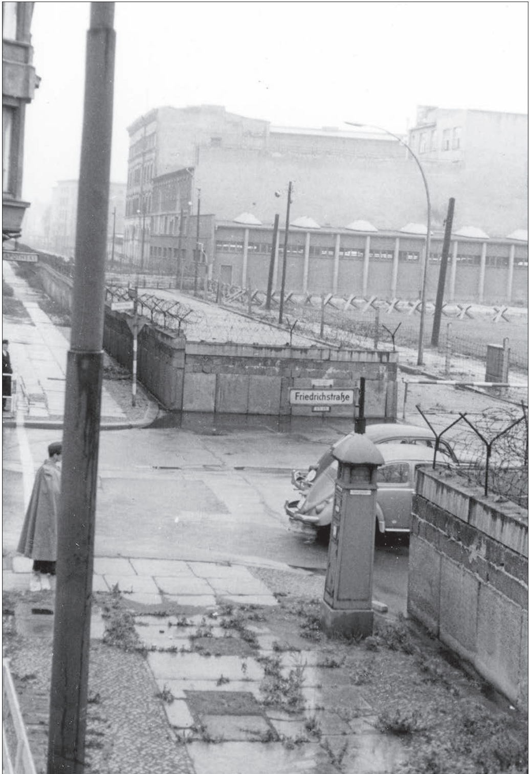
Berlin, Friedrichstraße. Határátkelőhely Nyugat-Berlin és Kelet-Berlin között a nyugati oldalról, 1964.