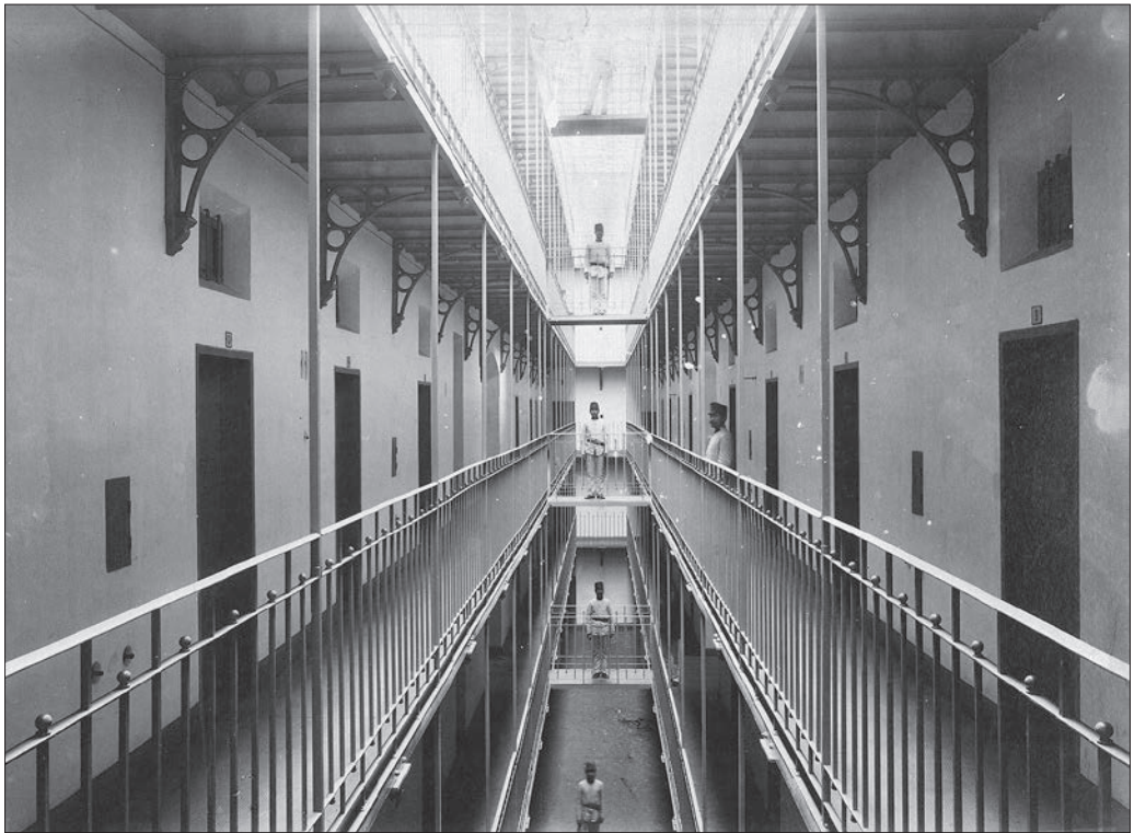
Budapest V., a Törvénykezési Palota Nagy Ignác (Koháry) utcai szárnya, a Budapesti Törvényszéki Fogház folyosói (később a Fővárosi Büntetés-végrehajtási Intézet börtöne). A felvétel 1892 után készült.

Levéltári jelzet: HU.BFL.XV.19.d.1.07.174