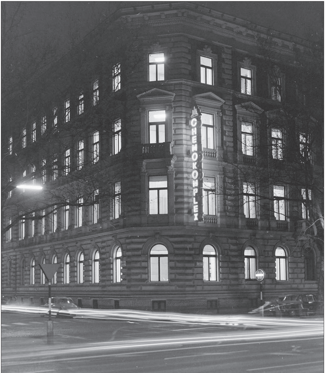
Budapest VI. Andrásy út (Népköztársaság útja) 60., a Csengery utca sarkon. CHEMOKOMPLEX székház, 1972.