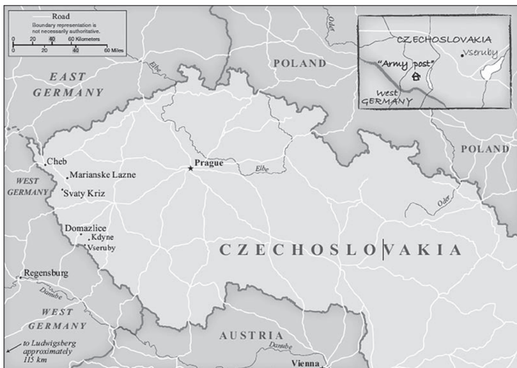
A Kámen-akció legfontosabb ál-határátkelőhelyei 1948–1952.

nem volt ritka, hogy 70 000 korona „csempészdíjat” kértek el. 22 A szervezők rendszerint megtiltották a „leendő határsértőknek”, hogy bármiféle tömegközlekedési járművet vegyenek igénybe. Ha az illetőnek volt saját gépkocsija vagy motorkerékpárja, azt is kockázatosnak minősítették, mert a magyarázatok szerint a rendszám alapján arra már vadásznak a hatóságok. Ezért egy előre megbeszélten helyen az embercsempészek saját – valójában a Belügyminisztérium tulajdonába tartozó – autón, teherautón vitték el az áldozatot. Amennyiben szükségessé vált a pihenő, vagy el kellett tölteni valahol egy éjszakát, akkor a délnyugat-csehországi Kdyněban lévő „Kék Csillag” ( Modrá hvězda ) nevű szállodát használták – ahol csak StB-tisztek és ügynökök tartózkodtak, és adták ki magukat turistáknak vagy a személyzet tagjainak. Itt az „emigrálók” teljes ellátást kaptak, miközben biliárdoztak és a tulajdonos feleségével beszélgettek, aki igyekezett megnyugtatni őket, és bátorságot önteni beléjük az előttük álló úthoz. Miután elhagyták a szállodát, a célszemélyt a német területekkel határos cseh vidékre vitték. Ezt azzal magyarázták, hogy egyedül csak a bajorországi szakaszon állomásoznak amerikaiak – ezzel még hihetőbbé téve a műveletet, mert a többenél, vagyis Ausztria északi részén (1955-ig) és a később-