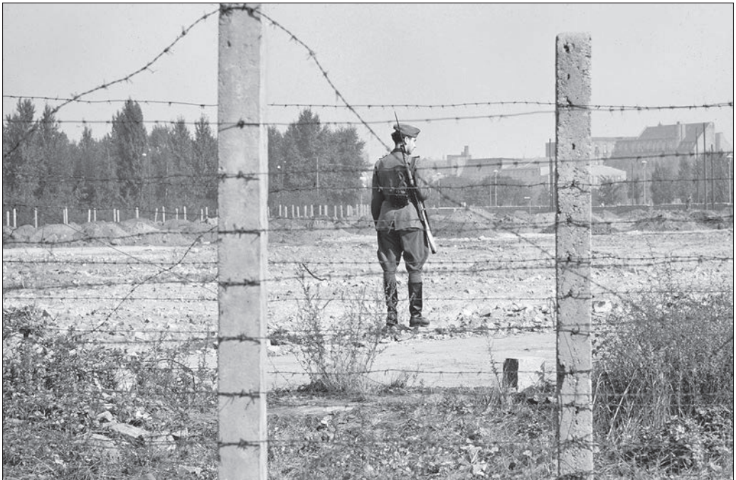
Kelet-Berlin, a felvétel a berlini fal építéskor, a Potsdamer Platz irányából északkelet felé készült. Háttérben a Behrenstraße eleje látható, 1961.