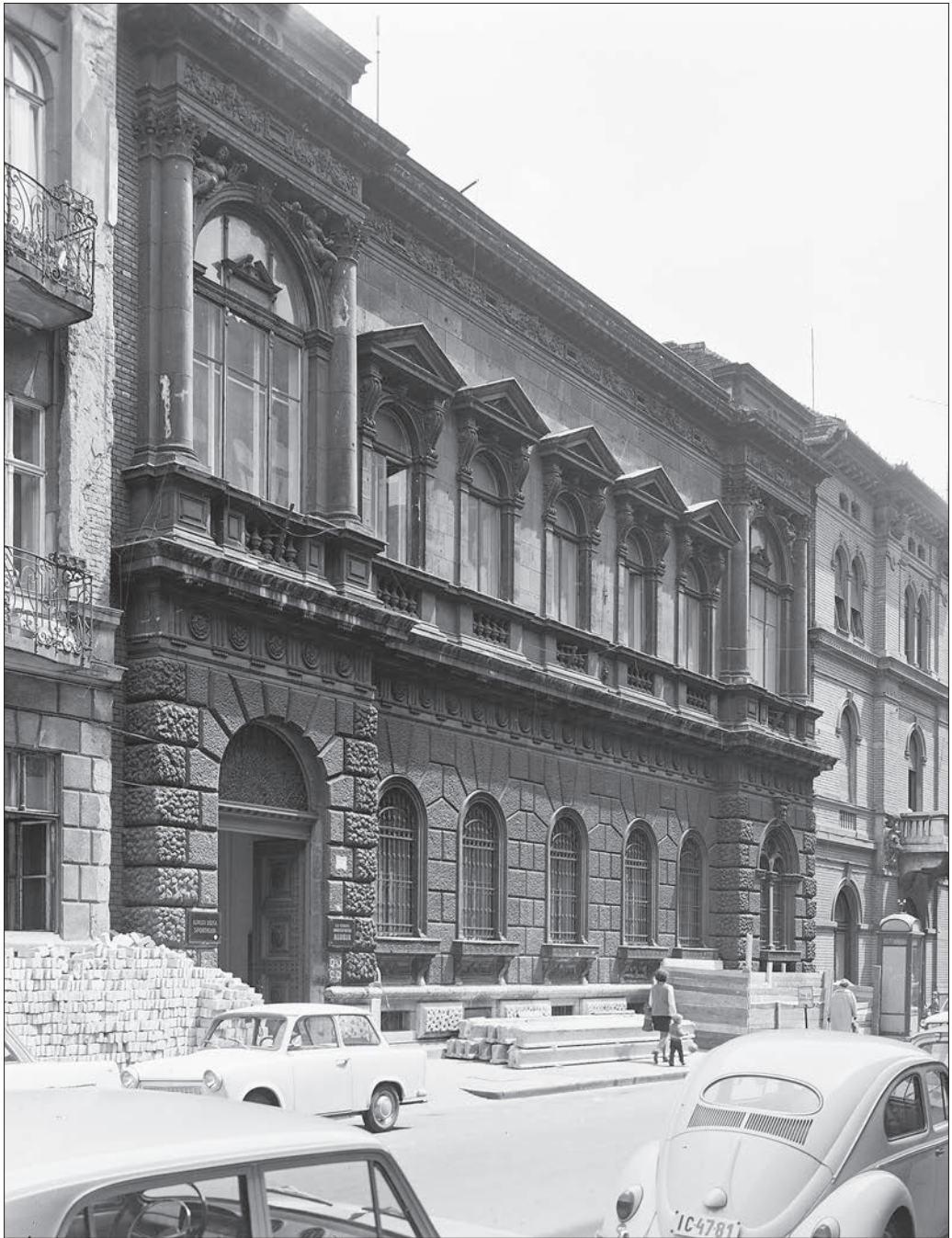
Budapest VI. szemben közepén az Eötvös utca 7-es számú ház, 1973.