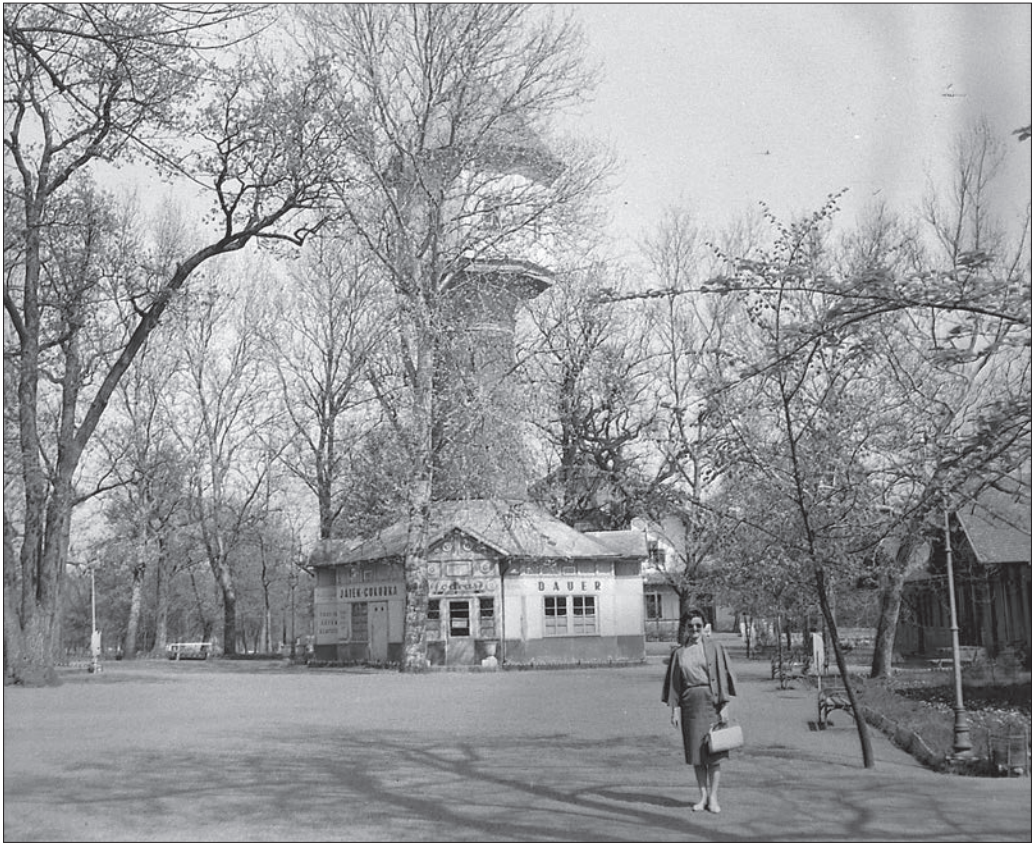
Nyíregyháza, Sóstófürdő, 1962.