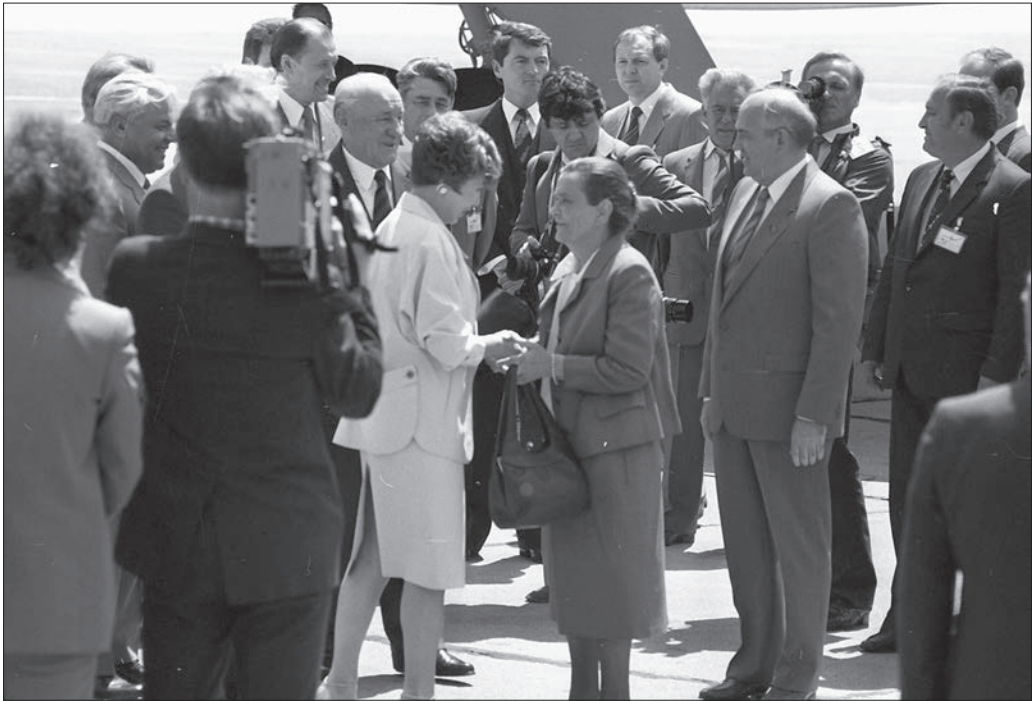
Budapest XVIII., Ferihegyi (ma Liszt Ferenc) repülőtér, Kádár János és Mihail Gorbacsov, a szovjet pártvezető fogadtatásakor, 1986. június 8-án.