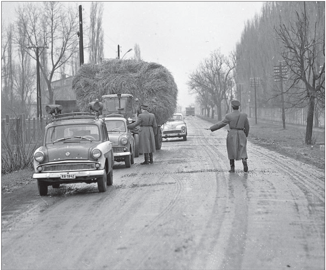
Berettyóújfalu, Honvéd utca, igazoltatás a 47-es főúton, 1969.