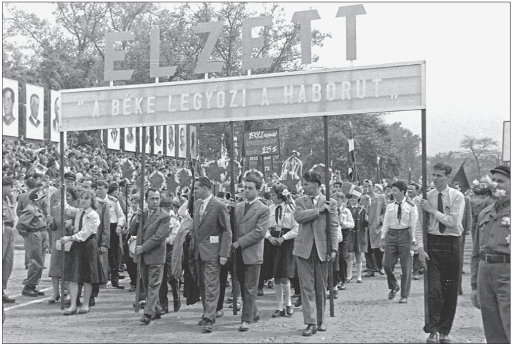
Budapest XIV., Ötvenhatosok tere (Felvonulási tér), május 1-i felvonulás, 1961.