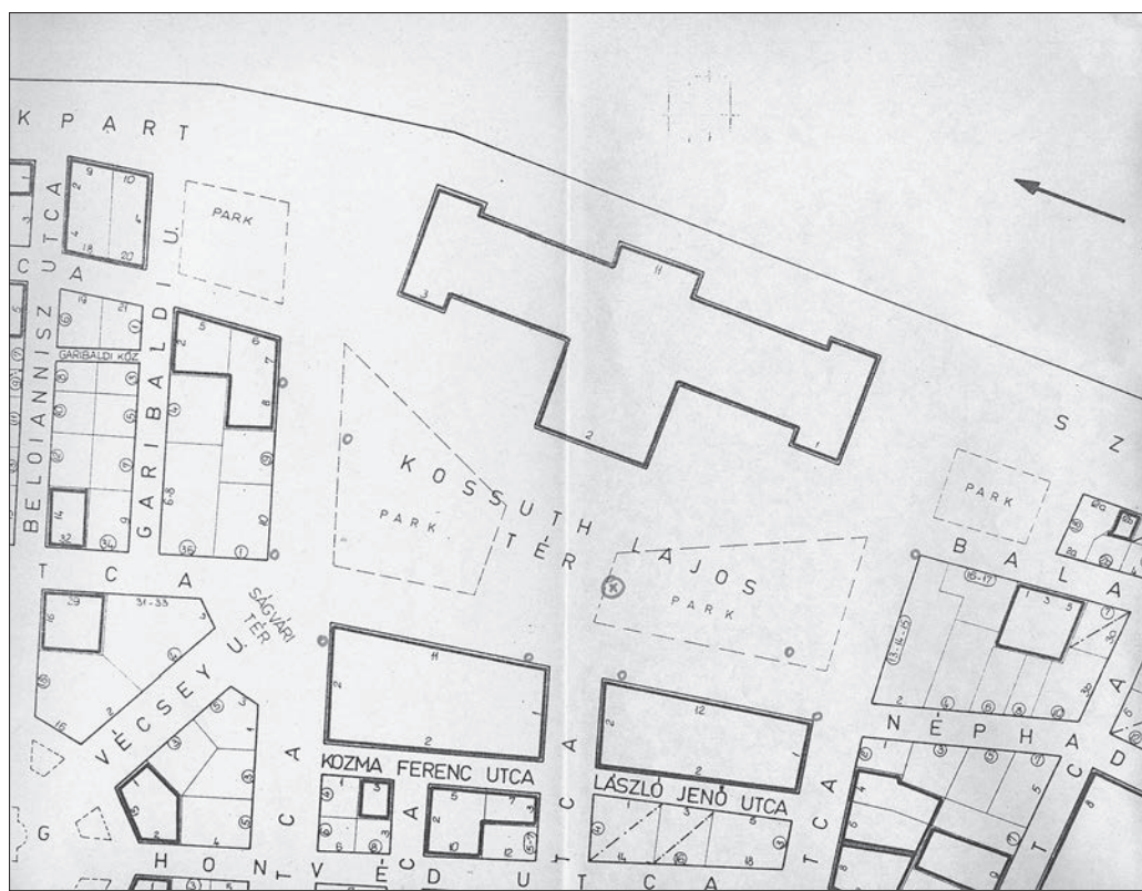
A Parlament, illetve a Kossuth Lajos tér környékének helyszínbiztosítási vázlat a felállítási pontokkal és a parancsnok megfigyelési helyével.

mények az alábbiak voltak: a Hősök terén tervezett koszorúzási ünnepség, a Felvonulási téren található Lenin-szobor előtti, illetve a Szabadság téri megemlékezés, továbbá a Csepeli Szerszámgépgyár meglátogatása, a pesti belvárosi séta és a Meriklon gazdasági társulás meglátogatása. Ezenkívül az MSZMP KB székházát, valamint a Parlamentet is fokozottan biztosított helyszíneként jelölték ki. 39 Fennmaradt három térképvázlat is, amelyek Gorbacsov és kísérete kiemelt programjainak helyszínbiztosításáról tájékoztatnak. A Szabadság téri koszorúzás ideje alatt a teret és környékét 40 felállítási helyről, azaz olyan pontokról figyelték meg, ahonnan a legjobb rálátás nyílt az ellenőrzés alá vont területre, a parancsnok pedig az emlékműhöz közel helyezkedett el. 40