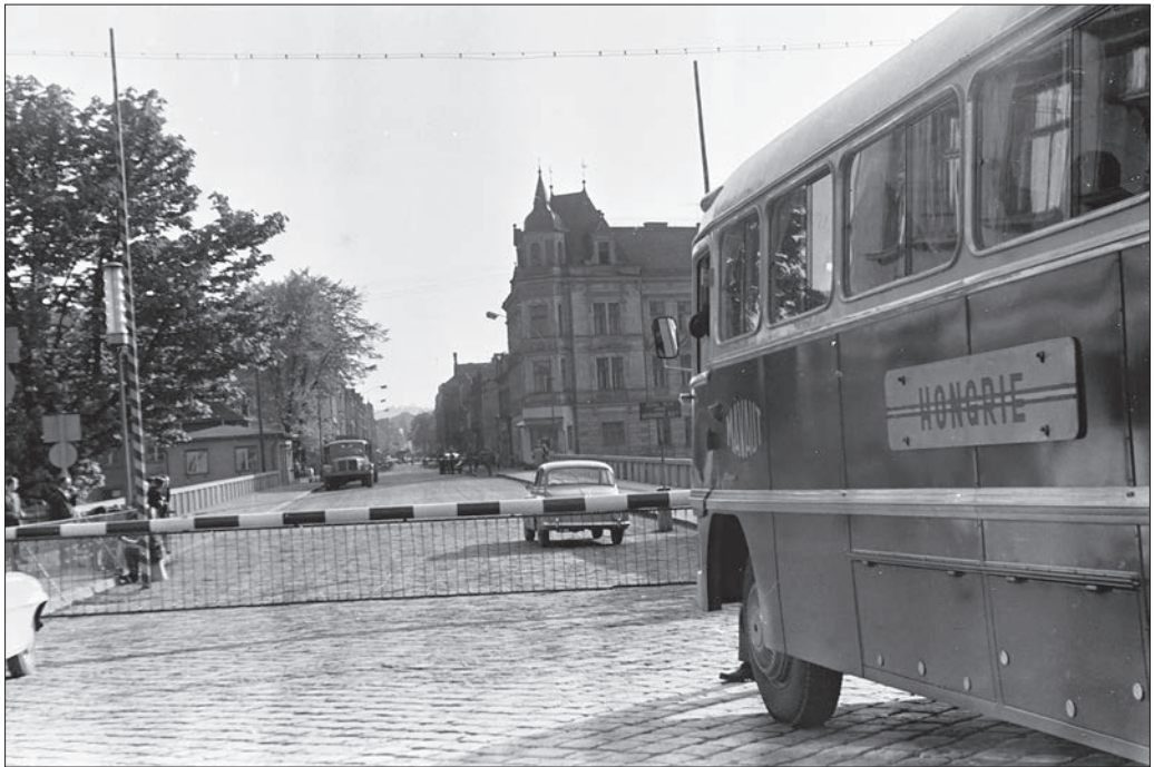
Český Těšín határátkelő, Csehszlovákia, 1965.