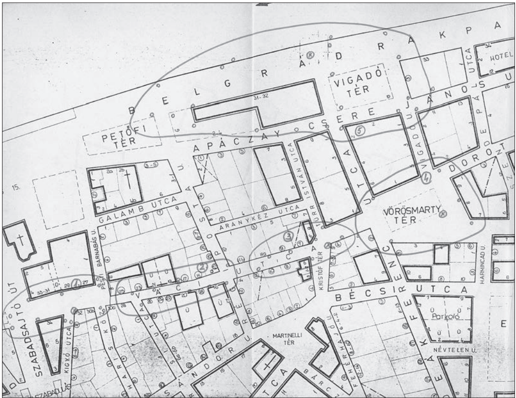
A Váci utca és a Vörösmarty tér környékének helyszínbiztosítási vázlata a felállítási pontokkal és a parancsnok megfigyelési helyével.

A Parlament épületének, illetve a Kossuth Lajos tér és környékének biztosítására pedig kilenc felállítási helyet jelöltek ki, a parancsnok helye a Parlament főbejáratával szemben, a park jobb oldalán volt. 41