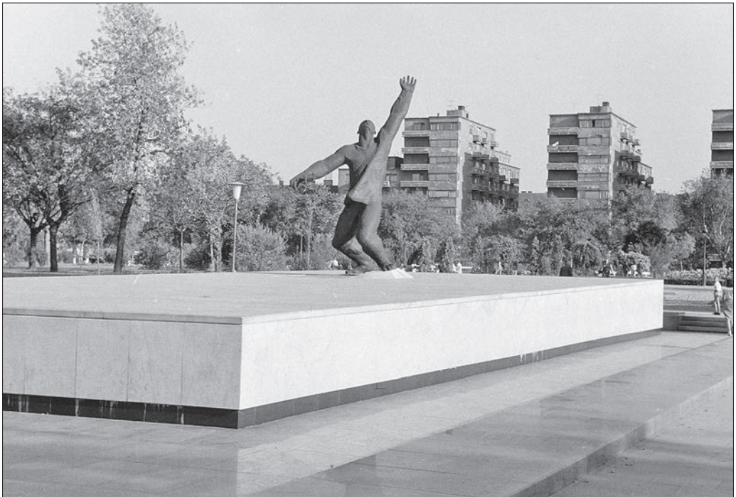
Budapest VIII. II. János Pál pápa (Köztársaság) tér. Az ellenforradalom mártírjainak emlékműve (id. Kalló Viktor, 1960). Háttérben az Országos Társadalom- biztosító Intézet (OTI) lakóház-csoportja, 1960.