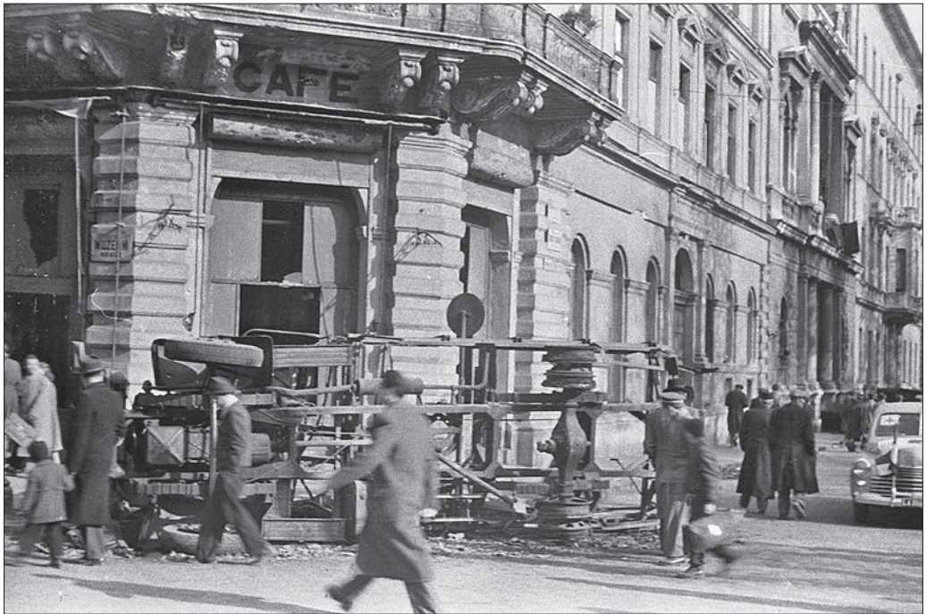
Budapest VIII., Múzeum körút – Bródy Sándor utca sarok, Múzeum kávéház, 1956.