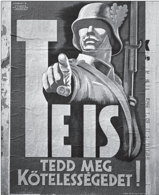
3. kép. 1942-ben Budapesten készült fotó, rajta Légrády Sándor Te is tedd meg kötelességedet! címfeliratú plakátja 43