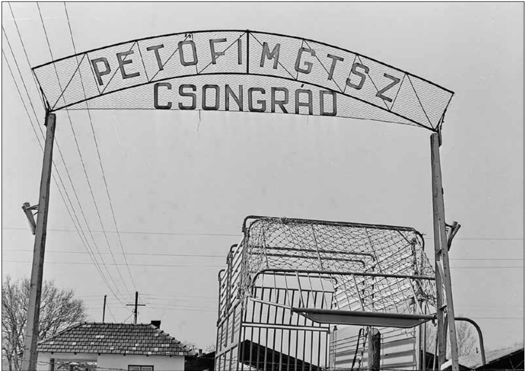
Csongrád megyei Tsz., 1970.