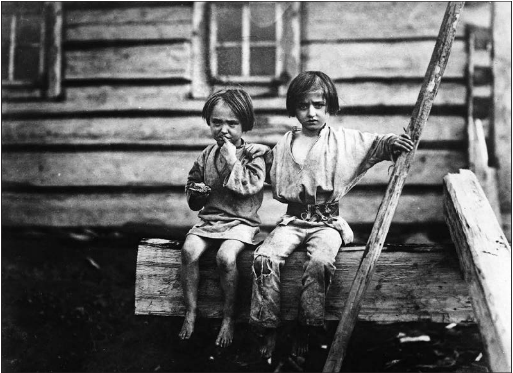
Mezőháti ruszin gyerekek, 1907