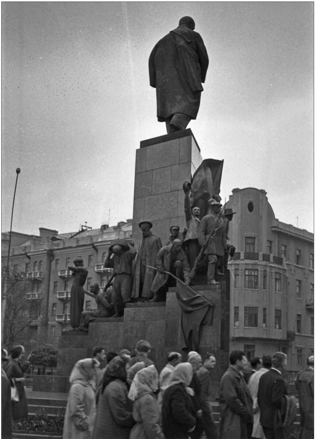
Élők és holtak. Tarasz Sevcsenko szobra Harkivban, 1965