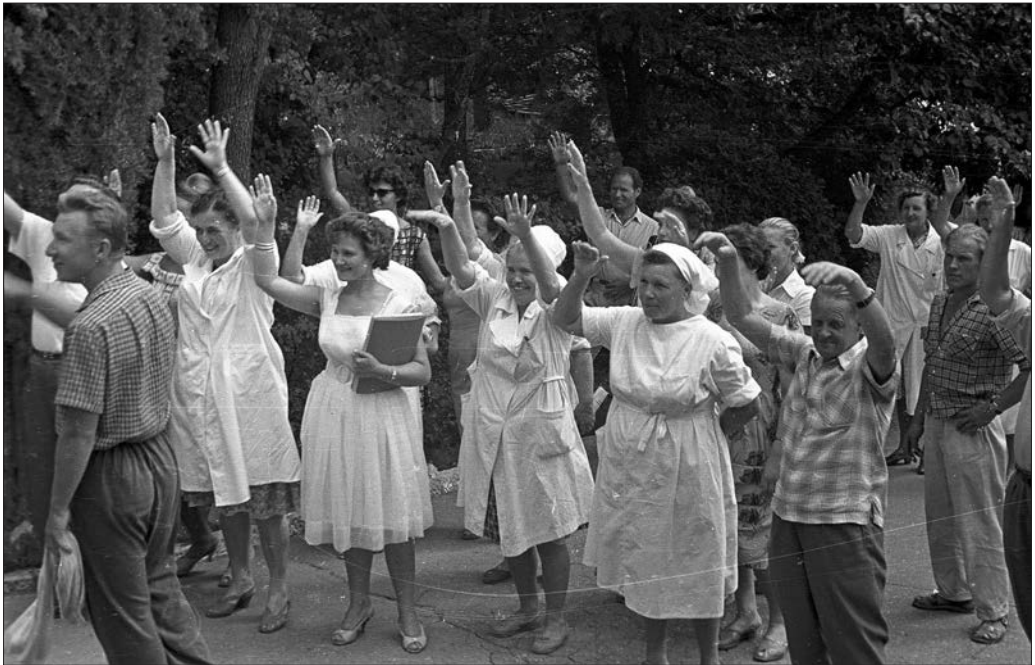
Búcsú a Krímtől, 1963