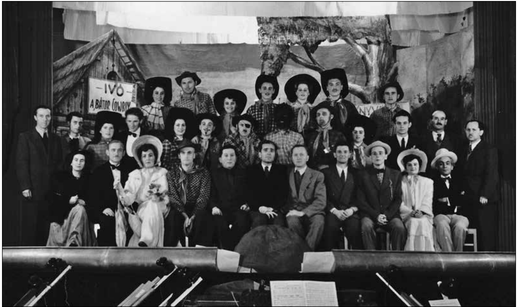
5. kép. Az 1954-ben bemutatott Leányvásár című operett szereplői 72

a helyi együttest. 68 Ugyanakkor Vasváron a munka zavartalanul folyt tovább. 69 Ennek a helyzetnek köszönhetően kaphatta meg a kőszegi fúvószenekar azt a politikai értelemben kitüntetett és látványos feladatot, hogy 1957. augusztus 20-án közreműködtek a szombathelyi munkásőr zászlóalj és a járási század zászlóavatási és eskütételi ünnepségén. 70 Mindezt egy kőszegi reggeli zenés ébresztőt követően. 71