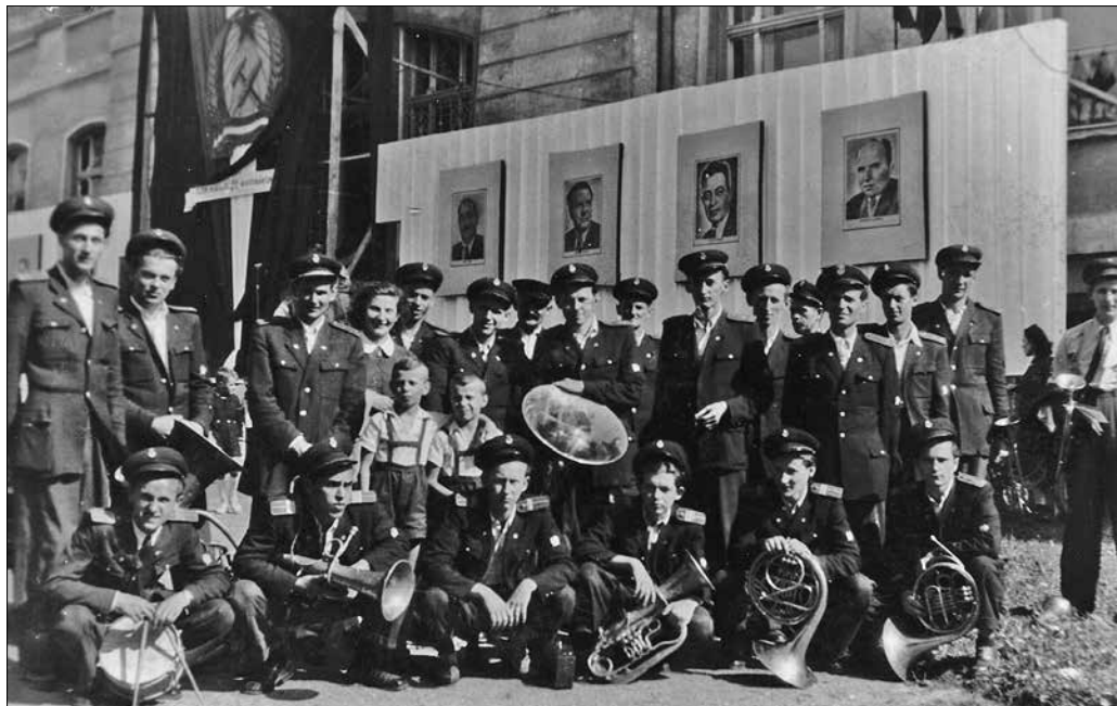
2. kép. 1954. augusztus 20-án Szombathelyen 23