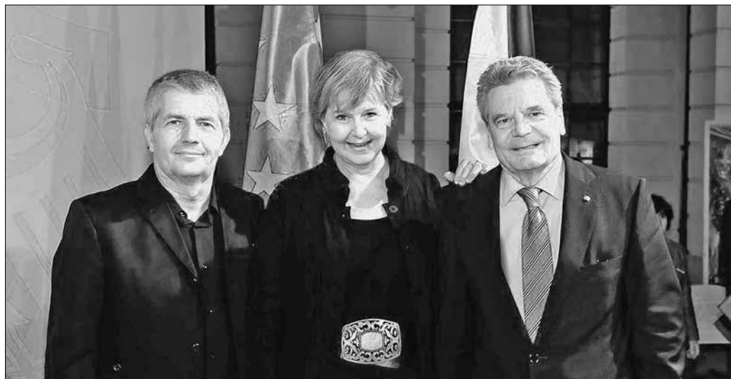
1. kép. Szövetségi biztosok. Balról jobbra: Roland Jahn, Marianne Birthler, Joachim Gauck 10