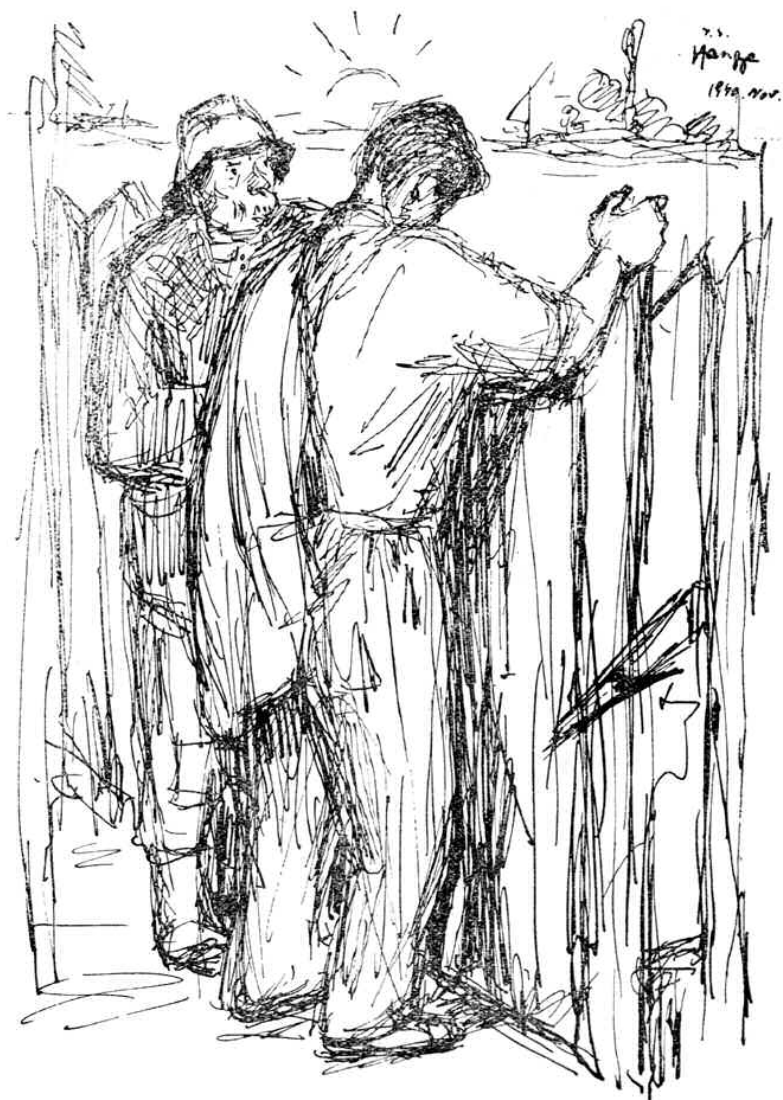
Hangya András rajza