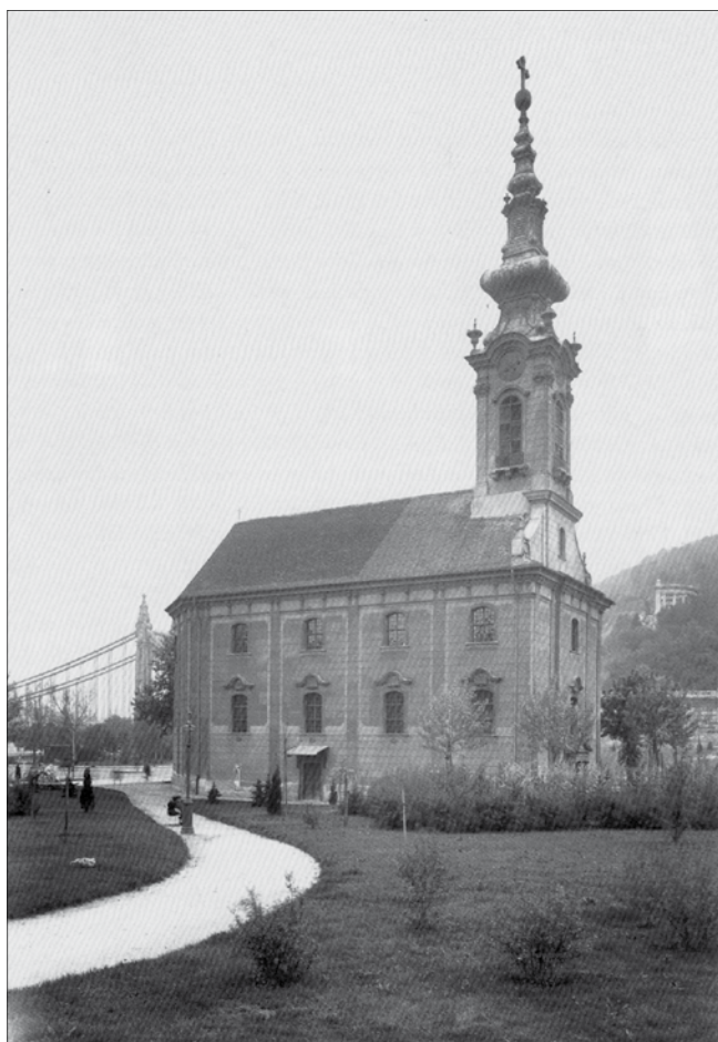
A tabáni szerb székesegyház a környező városnegyed lebontása után, 1940 körül