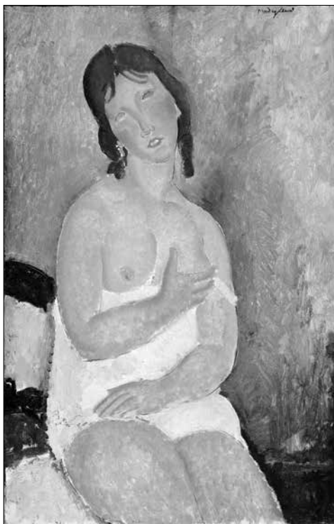
Amedeo Modigliani: Fiatal nő ingben (1918) olaj, vászon (100 x 65 cm) Albertina, Bécs – Batliner- gyűjtemény

„Az avantgárd arcképfestője”, ez a harmadik tárlatrész, amely az első világháborús párizsi bohémélet egész nemzetközi kavalkádját látatja. Az U-alakú folyosó hajlatában két teljes sarokfalat is betölt a nagyméretű szemléltető ábra: a közeli barátok és tőle valamivel távolabb álló pályatársak, a műgyűjtők és mecénások, a modellek és kritikusok, írók, költők és