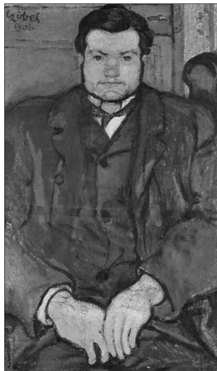
Czóbel Béla: Férfi portré (1906) olaj, vászon (92 x 54 cm) A Centre national des arts plastiques tartós letétje, Musée des Beaux-Arts, La Rochelle