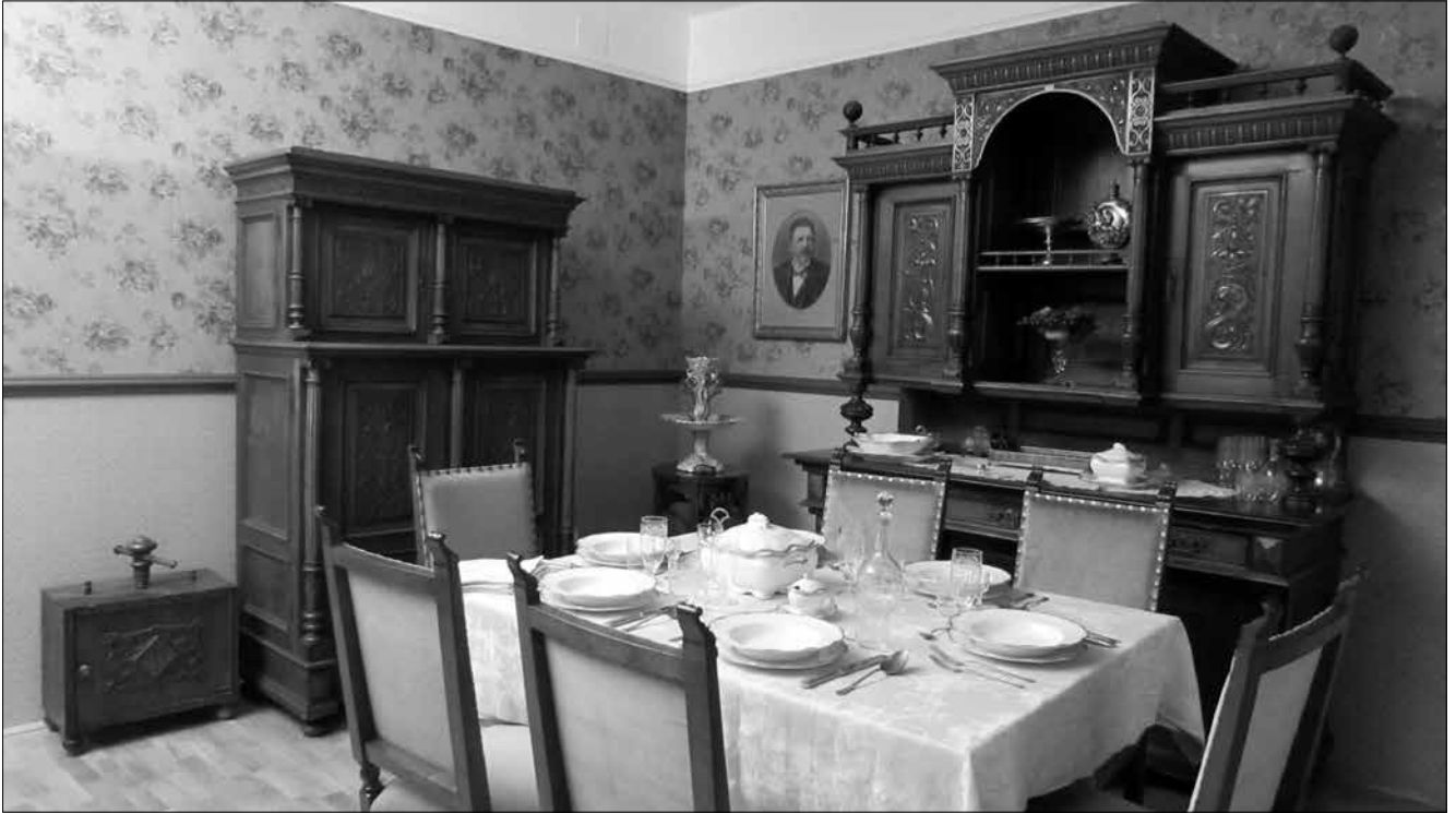
Középosztálybeli ebédlő ónémet bútorokkal

Óbudán, a Magyar Kereskedelmi és Vendéglátóipari Múzeum új állandó kiállítása Gundel Károly és Karinthy Frigyes 1933-ban megjelent illemtankönyvének címét kölcsönözte. Egyébként Karinthy , Gábor Andor , Heltai Jenő és Molnár Ferenc eredeti aláírása is felbukkan a tárlaton. A budapesti New York kávéház legendássá vált, a szakirodalomban sokat emlegetett asztalkájának kerek, fehér márvány lapján kézjegyükkal Major Henrik karikaturista 1918 táján róluk készített portréinak találó voltát „hitelesítették”. A bemutatott tárgyak zöme a XIX. század végétől a második világháborúig terjedő polgári életvitelt idézi fel, a szobabelsők sora pedig az otthoni és a hivatásszerű hazai vendégfogadás tereit mutatja be.