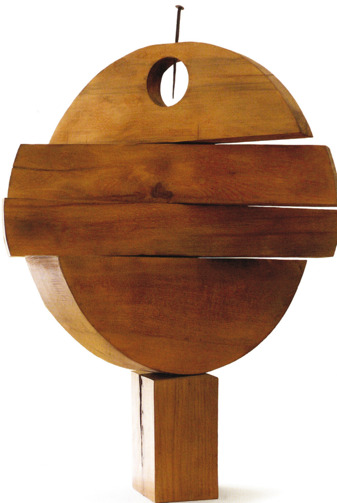
Szféra (2000, bükkfa, fém, 80x40x10 cm)