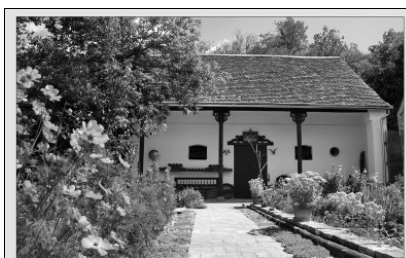
Johann Lux Stallgalerie im Sommer Kalas/Kalaznó