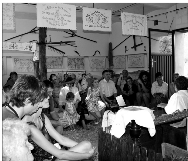
Sokan látogatják a kalaznói házat