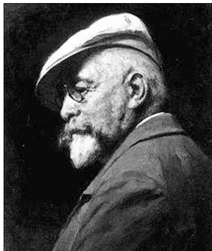
Benczúr Gyula: Önarckép (1917)

A következő napokon az emeleti ablakból figyelte, hogy Guszti – a kisfiú – valóban könyvvel a kezében sétál s botja végével szántja a homokot. Azt persze nem látta, hogy a nagybetűk milyen átalakuláson mennek keresztül. Az A-k létrává válnak, s hamarost meszelő meg kéménykotró rajzolódnak rájuk. Az S-ek veszettül támadó kígyókká tekerednek, az I-k a város tornyaivá, az M-ek pedig a környező hegyekké formálódnak. A színek azonban nagyon hiányoztak. Különösen akkor, amikor Kassán átvonultak a Görgey-huszárok. A város fellobogózva, az arcok kitüzesedve. A polgárok és gyerekeik mind az utcán tolongtak, virágokat szórtak. Mindenki osztozni kívánt a hazafias történelmi pillanatban. Guszti szíve is belesajdult a gondolatra, hogy ez a látvány maga ezernyi színével elveszik a számára. Hetekig kínozták lelkét a tehetetlenség, míg egy lába elé hulló rózsafej megoldást kínált. Ettől kezdve újabb heteken át a virágágyásokat járta, s összeszedte-letépkedte a különböző szirmokat. A kert egy – avatlan szem előtt takart – tökéletesen szélvédett szegletében titokban dolgozott. Ugyan soha nem hallott még a