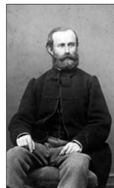
Mocsáry Lajos: „Ne hagyjuk magunkat ábrándos régiség-búváraink által feltűzelni, ne hagyjuk magunkat suhanc fiaink által orrunknál fogva vezetni. . . Ne vesszünk össze a közös hősökön!”

– közöttük Mocsáry korábbi barátai és eszmetársai – az Ausztriával való „kiegyenlítődé” lázában égtek. Bár Mocsáry is őszintén tisztelte Deákot, a függetlenségi eszme védelmében nyílt levelet jelentetett meg, amelyben – éppen a nemzetiségi kérdés tárgyalásakor fölvetett saját hatalom és kormány hiányában – elítélte a kiegyezést, s figyelmeztetett azokra a káros következményekre, melyekkel számolni kell. Nyílt levele – az uralkodó áramlattal szemben – természetesen teljesen hatástalan maradt. 1874-től 1884-ig a Függetlenségi Párt elnökeként próbálta a belviszályokat elsimítani. A legtöbb gondot a szélsőbalon szervezkedő antiszemitaok okozták neki. Ő maga többször is éles hangon elítélte a zsidóellenességet. Amikor az országgyűlés megtárgyalta az ún. tapolcai kérvényt (amelyet a kerület a katolikus egyház támogatásával az 1867-es „zsidóemancipáció” eltörléséért nyújtott be), Mocsáry is felszólt a vitában: „A klerikális és az antiszemita reakció összeölekezett, s most már nyílt sisakkal, valódi színben tűnik fel... Remélem, hogy Magyarország törvényhozása jövőre is ellent fog tudni állni a szabadság ellenségeinek és odúiba fogja mindenkor visszakergetni a reakció huhogó baglyait.”