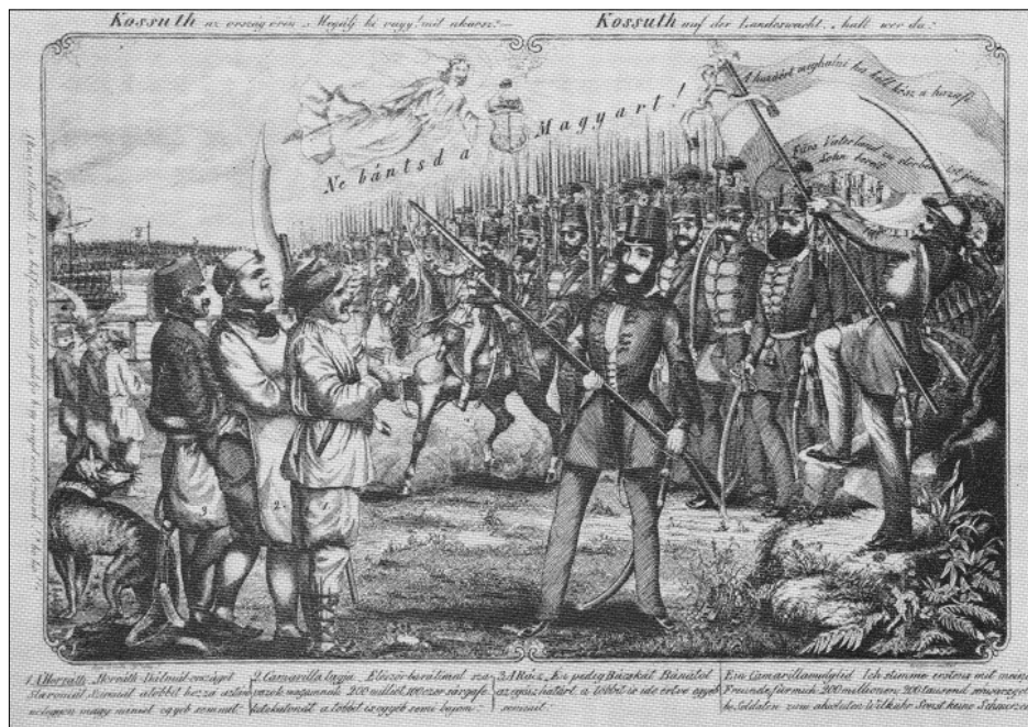
A Kossuth vezette kormány szoronyt szeg az a nemzetiségek követelésére