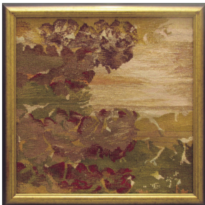
Maevszka Koncz Borjana: Virágos óceán 1