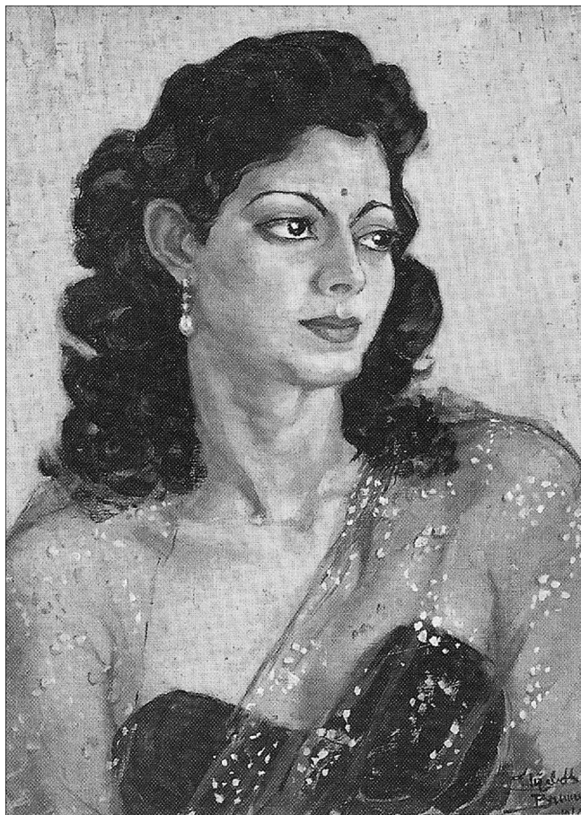
Brunner Erzsébet: Prija Csatterdzsi portréja

hagytak maguk után. A buddhista vallás előírásait követték, idővel lélekben is teljesen indiaivá váltak. (Anyja elhunytát követően Brunner Erzsébet az indiai állampolgárságot is felvette.) Képeikből nagyszerű albumuk jelent meg, amihez Tagore és Gandhi írt előszót.