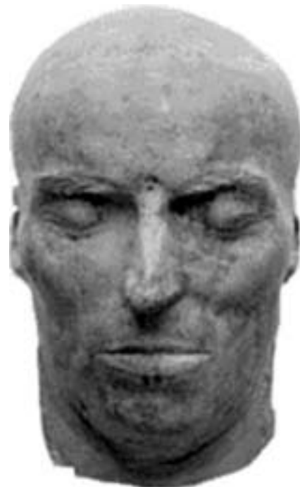
Schiller halotti maszkja