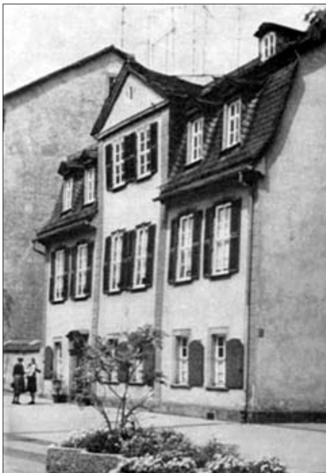
A Schiller-ház Weimarban

dós, Wilhelm von Humboldt volt. Jénában szinte minden este találkoztak és a kései órákig ültek az asztalnál, Humboldt tulajdonképpen azért is költözött Jénába, hogy Schiller közelében lehessen. De a költő később és másokkal is szoros kapcsolatban állt, így Wieland -al és Herder -el, kiadóival Göschel -el és Cotta -val és természetesen Goethe -vel, akik nemcsak barátokat, hanem egyszersmind értékes vitapartnereket jelentettek számára. Velük tudott elmenekülni a mindennapok szürkesége és gondjai elől, amely különösen életének első szakaszában oly nyomasztó súllyal nehezettek rá. Ezeknek a barátságoknak köszönhetjük a költő terjedelmes levelezését is, amely fontos kultúr- és irodalomtörténeti adalékokat szolgáltat a kor, a költő és más szellemi nagyságok jobb megértéséhez.