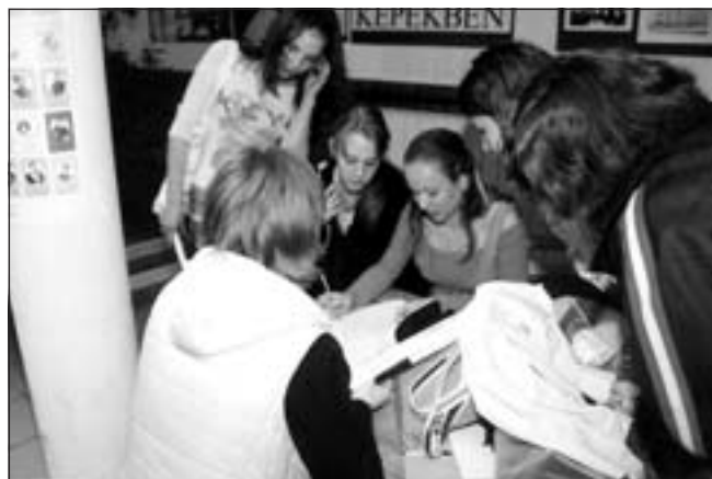
Dolgoznak a csapatok az iskola aulájában, ahol Schiller-kiállítás fogadja a látogatókat