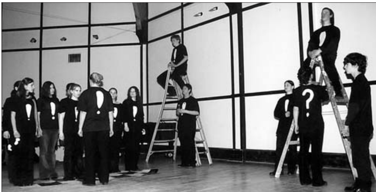
Képek a Demetrius-előadásból