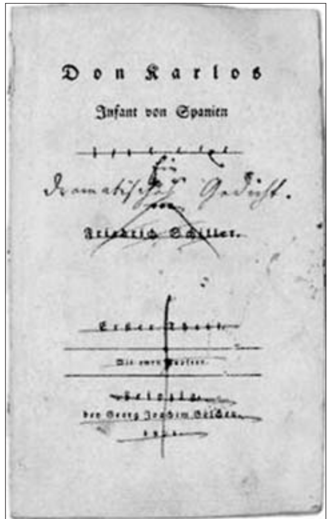
Schiller egyik legfontosabb műve, a „Don Carlos” címlapja