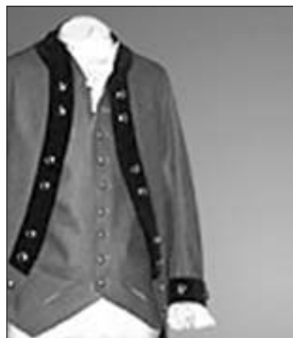
Ilyen iskolai egyenruhát hordott Schiller