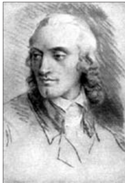
Schiller egyik utolsó képe 1804-ből