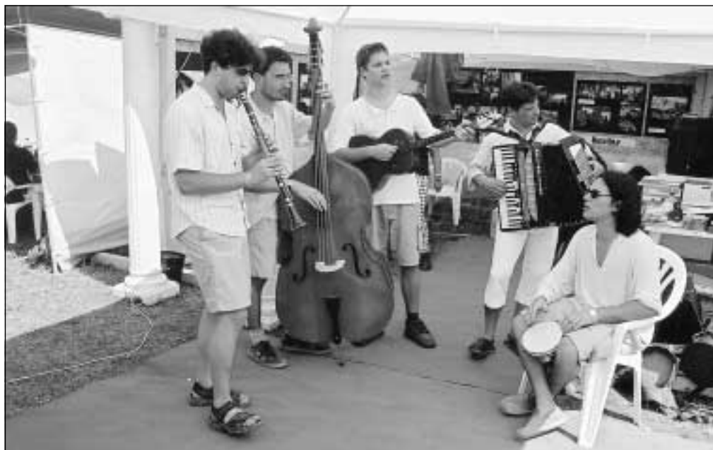
A Söndörgő együttes az Óbudai Szigetfesztiválon