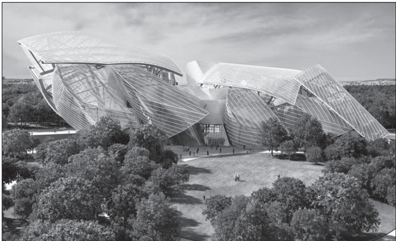
1. melléklet: Frank Gehry: Fondation Louis Vuitton, Párizs, 2014

tételezzük, Gehry elbeszélő építészetet művel, amikor egy figuratív formát választ modellül. A hajó-toposz egyébként nem ismeretlen a modern és kortárs építészetben, előzményként említhetjük Le Corbusier épületeit vagy Utzon sydney-i Operaházát. De magánál Gehrynél is megjelent ez a motívum korábban is, például a bilbaói múzeumában. Ám tévedés lenne az architektúrát pusztán a figuratív törekvésekből eredeztetni.