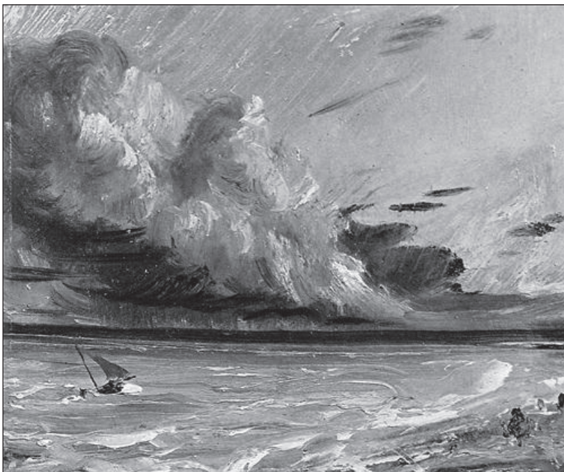
3. melléklet: John Constable: Coast scene with breaking cloud sun (1830 körül)

A megkomponált felkavarodás ellenére az épület kiválóan „működik”: a közlekedő tereken, a nyitott tetőtéren, azaz a művészeti értelemben vett élménytereken túli praktikus helyek, mindenekelőtt a galéria lényegét jelentő kiállítótermek, jól funkcionálnak. Ugyanakkor kétségtelen, hogy az épület egésze rivalizál a benne bemutatandó kortárs képzőművészettel, amennyiben „óriás szoborként” maga is egy képzőművészeti alkotássá válik. De miért is ne válna azzá? Vajon nem éppen erre törekszik az építészet a kezdetektől fogva – mióta csak felismerte saját reprezentációs lehetőségeit? S vajon nem éppen a mind progresszívebbé váló kortárs múzeumépítészeti tanítja egyre makacsabban a közönséget arra, hogy az architektúrát ne pusztán háttérbe húzódnó, funkcionális térnek tekintse, jelen esetben a White Cube hűvös díszletének, hanem erőteljes esztétikai hatásokat kiváltó, autonóm műalkotásnak?